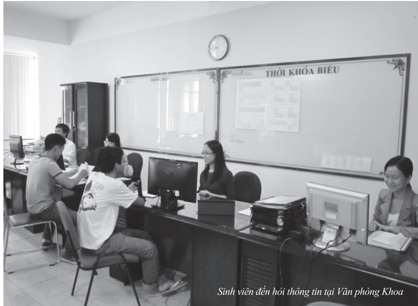
Sinh viên đến hỏi thông tin tại Văn phòng Khoa

Xin cảm ơn Thầy! Kính chúc Thầy và UEF ngày càng thành công!●