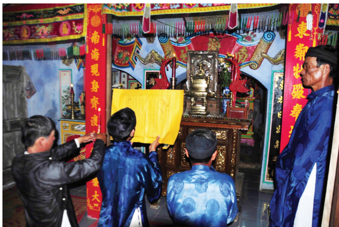
Hình 2. Đọc bài văn tế cúng Cá Ông tại Lăng Đông Hải

wang. Hà bá thủy quan tôn thần. Sắc tặng hoàng ân quảng trạch trung đẳng thần. Lý ngư lý lực đại tướng quân. Tả biên giang hữu biên giang. Cập bộ hạ đẳng tùy tùng chi thần. Bốn xứ kheo long thủy thạch vạn thần. Tiền hiền khai khẩn, hậu hiền khai cư. Phụ tùng tiền vãng cảnh cổ tích tiền nhơn, hàm tư chứng giám chi nghi vĩnh tứ bình an chi khánh. Viết cung duy... ”. Kết thúc là lời cầu mong thần linh độ trì cho dân làng luôn gặp điều may tránh điều dữ: “ Tôn thần liệt vị, Thủy quốc anh linh, Hải Trung cự tộc, Thiết du tử ốc thần tuế độ ư sanh, Cung diêu huyền cơ ư, vạn tử, Thân như đại tượng, khẩu bất thông kình, Cứu độ nhơn sanh, thiên tai thủy nạn. Nam Hải đức ngư độ mạng cấp cứu, nhơn sanh hữu cầu tất ứng. Dĩ hình khuyết linh khi trạt khuyết hình công tất tự chi cảm tức thông chi kỳ tức ứng thần chi cảm cách, đức lại chương linh từ tuế, Hộ bốn Lân đẳng, xuân hạ kiết khánh, thu đông an bình, Thượng cường trường thanh viết phú viết khương, Bảo an vạn vật củng cố thiên linh, Sĩ đẳng nông tẩn, Thương đất công tinh, Ngư thâu bội lợi, Biển tịnh phong bình, Thông toán thanh phát, Dưa đậu phong vinh, Kê trư tế tế nhơn vật hàm hanh, niên niên tăng cao thọ, Trùng trùng giai phú chi nhơn vinh, Chư hung tống khứ, bá phước lai nghinh, Ngưỡng lợi thân linh, lưu phúc lưu ân, bảo phò toàn Lân gia chi phước dã, Phục duy. Cẩn cáo ”.[2]