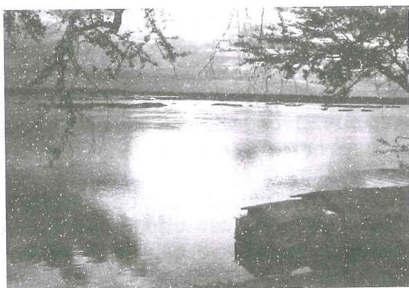
Sông Mékong, Karatie, Campuchia