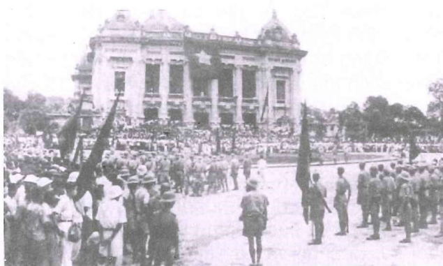
Mít-ting tại Nhà hát Lớn Hà Nội, tháng 8-1945.

Cách mạng - Bản thân khái niệm ấy đã chứa đựng trong nội hàm của nó tính sáng tạo. Cách mạng tháng Tám năm 1945, dưới sự lãnh đạo của Đảng Cộng sản Việt Nam mà đứng đầu là Chủ tịch Hồ Chí Minh, nhân dân ta đã làm nên một kỳ tích - hiện thân của tính sáng tạo toàn diện và tiêu biểu nhất.