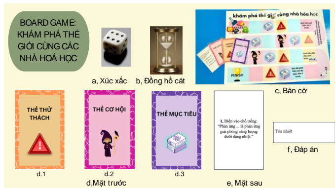
Hình 3. Bàn cờ và các thẻ bài trong “Khám phá thế giới cùng các nhà hoá học”

trò chơi. Hình 3 mô tả hình ảnh bàn cờ và các loại thẻ bài trong trong “board game” về “ Khám phá thế giới cùng các nhà hoá học ” đã được sử dụng để thiết kế tích hợp trò chơi với các yếu tố được mô tả trong các bước kể trên. Trong quá trình chơi thử, chúng tôi cũng tập trung đánh giá tính phù hợp ở luật chơi, tổng thời gian chơi với số lượng người chơi khác nhau, cũng như độ phù hợp của các bộ câu hỏi.