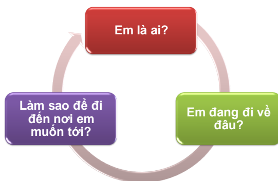
Hình 1. Các bước trong quy trình giáo dục hướng nghiệp (Vũ Đình Chuẩn, 2014) [7]

tiêu này, HS cần bắt đầu lập kế hoạch từ khi các em bước chân vào lớp 10 THPT, sau đó tiếp tục điều chỉnh kế hoạch hướng nghiệp của mình khi trải qua nội dung học các lớp 10, lớp 11, lớp 12 và có thể đưa ra quyết định đúng đắn vào cuối năm lớp 12 (lựa chọn học nghề hay hoàn thiện hồ sơ nộp vào các trường,... thực hiện sự lựa chọn con đường đi của mình sau thời gian học Trung học phổ thông).