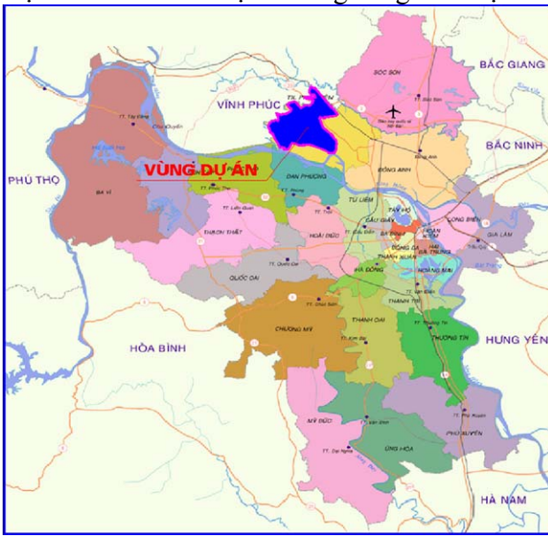
Hình 1. Bản đồ thành phố Hà Nội và vị trí vùng nghiên cứu

do đó kết quả nghiên cứu cho vùng này hoàn toàn có thể áp dụng cho toàn vùng thủ đô Hà Nội và các tỉnh lân cận ở đồng bằng Bắc Bộ.