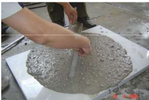
Hình 1. Thí nghiệm xác định độ chảy xoè của hỗn hợp SCC

Hỗn hợp SCC đạt yêu cầu khi: Đường kính Max của hỗn hợp SCC nằm trong khoảng 600 đến 800 mm, thời gian đạt được đường kính D = 500\text{mm} sau 3 đến 6 giây kể từ lúc bắt đầu rút côn; độ đồng nhất của hỗn hợp tốt không phân tầng, tách nước tại mép rìa ngoài của hỗn hợp.