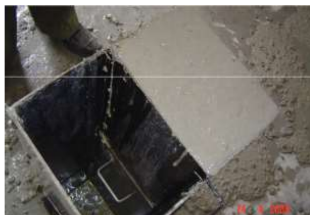
Hình 2. Thí nghiệm xác định khả năng tự lèn của hỗn hợp SCC