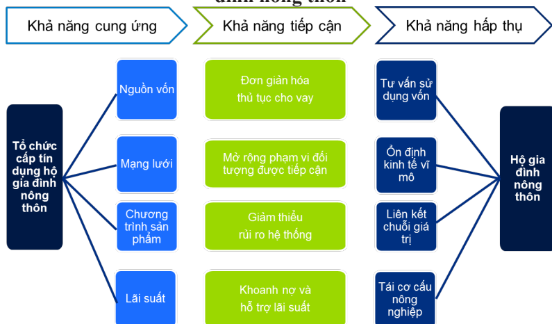
Hình 1. Các giải pháp chính sách tín dụng của ngành Ngân hàng trong việc thúc đẩy và phát huy hiệu quả tín dụng hộ gia đình nông thôn

Xây dựng cơ sở hạ tầng tổ chức chỉ đạo và cơ chế phối hợp đồng bộ