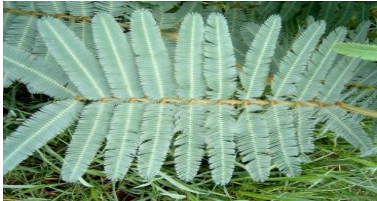
Ảnh 1. Lá số 4 của cây Mai Dương ở giai đoạn tăng trưởng với 10 cặp lá chết cấp 1 mang các cặp lá chết cấp 2

được duy trì ổn định ở 32 \pm 2^\circ\text{C} . Sai biệt giữa tốc độ hấp thu \text{O}_2 ở 10 giây đầu tiên (sau khi tắt sáng) và tốc độ hấp thu \text{O}_2 ổn định sau 10 giây tắt sáng biểu thị giá trị quang hô hấp của thực vật.