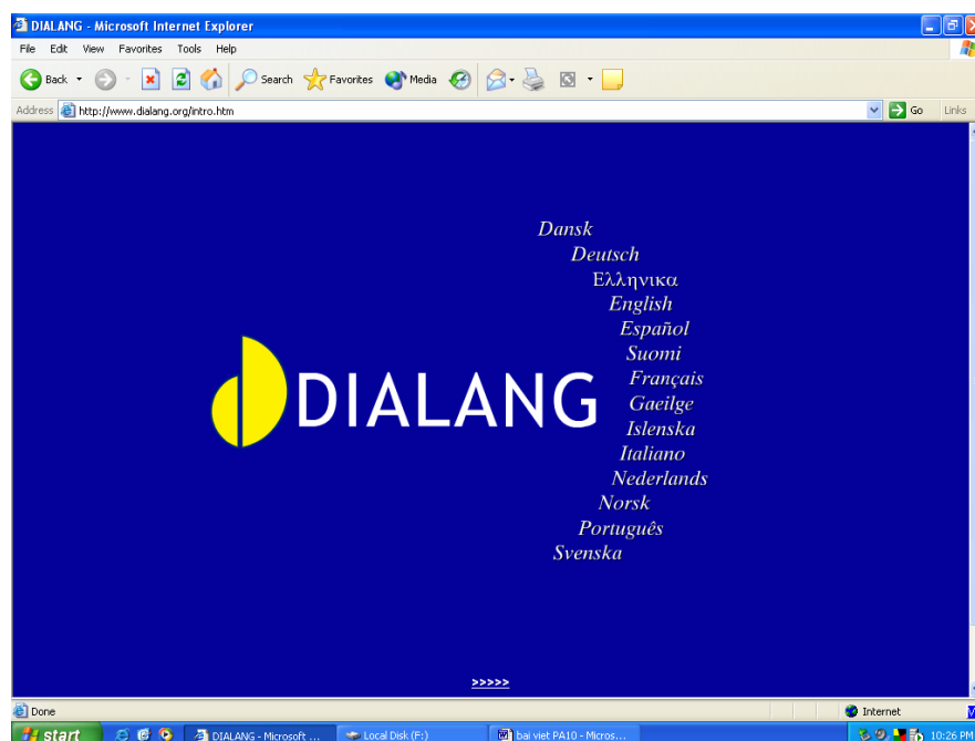
Hình 2. Trang đầu của Hệ thống kiểm tra trực tuyến miễn phí Dialang ( www.dialang.org )