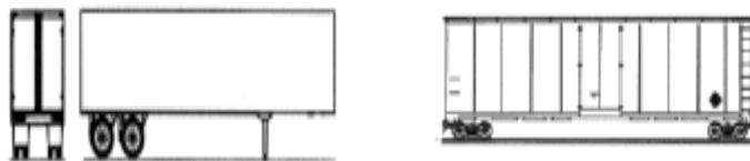
Hình 3. Xe chuyên dụng có thùng chứa nhiều ngăn (Mixed Cargo)

Đối với CTNH, phương tiện vận chuyển sẽ là các xe chuyên dùng. Đối với CTNH ở đây, thì không phải là chất nguy hại nguyên chất, mà chỉ là các vật liệu dính sót hóa chất, hoặc các loại hóa chất thừa thành cặn, không có giá trị sử dụng, nên chắc chắn hoạt tính không còn cao. Vì thế, có thể chọn loại xe có thùng chứa nhiều ngăn (box car mixed cargo), mỗi loại CTNH được để ở một ngăn khác nhau không tiếp xúc nhau.