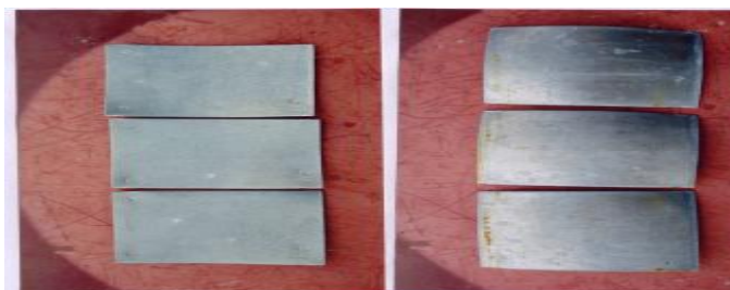
Hình 3. Ảnh mẫu kẽm sau 2 năm thử nghiệm (trái: mặt chính; phải: mặt trái)

Ở mặt trái mẫu tối sẫm đáng kể, nhất ở phần dưới. Các vết tối là những sọc phân bố không đều, cấu trúc xốp hơn mặt trên. Nguyên nhân hiện tượng này theo tác giả [6] là do mặt dưới luôn ẩm hơn mặt trên, làm tăng thời gian lưu ẩm tạo điều kiện cho các tác nhân ăn mòn trong khí quyển hoà tan thành dung dịch điện ly trên bề mặt, Cl - dễ dàng di chuyển gây ăn mòn cục bộ.