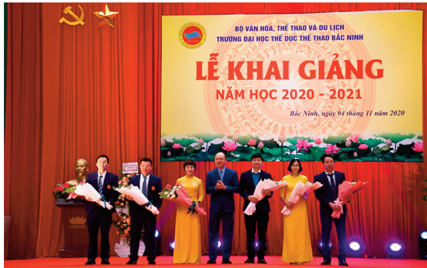
Trường Đại học TDTT Bắc Ninh tặng hoa chúc mừng các tiến sĩ tốt nghiệp năm học 2019-2020 tại Lễ Khai giảng năm học 2020-2021

Sau 62 năm thành lập, 60 năm kể từ ngày Hồ Chí Minh về thăm, Nhà trường đã từng bước nỗ lực xây dựng, trưởng thành và khẳng định vị thế của mình, trước những khó khăn, thách thức của nền kinh tế thị trường, được sự quan tâm của