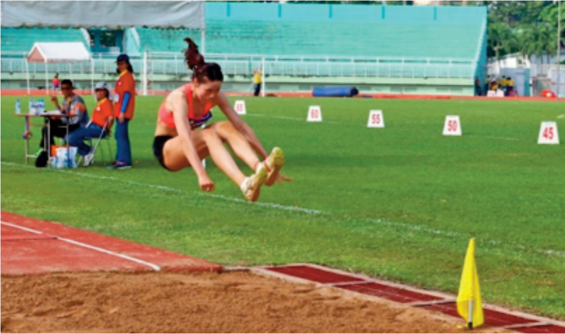
Đề nâng cao thành tích nhảy xa kiểu ngồi cho sinh viên Trường Đại học Sư phạm Hà Nội, tác động các bài tập phù hợp, có hiệu quả là vấn đề cần thiết