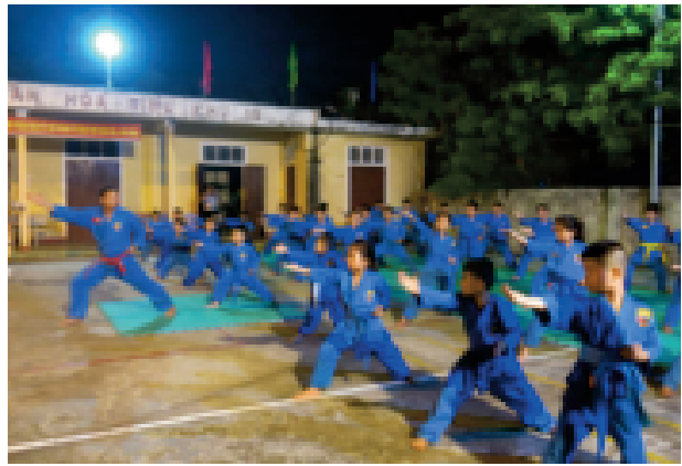
Có rất hiệu các biện pháp để nâng cao hứng thú của học viên trong tập luyện võ Vovinam

- Tổ chức ngoại khóa vào các ngày lễ, ngày nghỉ cuối tuần giúp các em trang bị thêm kiến thức về Vovinam.