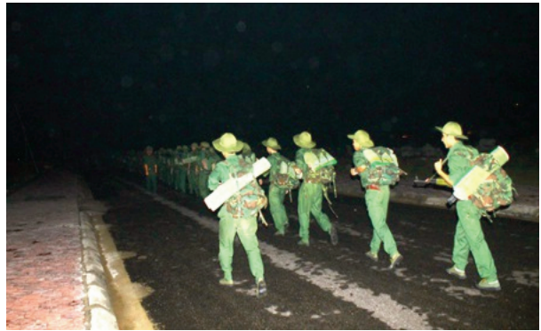
Có rất nhiều hình thức tập luyện phát triển thể lực cho học viên học viên An ninh nhân dân, từ GDTC nội khóa, TDTT ngoại khóa, hành quân dã ngoại...

nội dung chính của chương trình thì được áp dụng các bài tập thể lực mà các giảng viên thường áp dụng từ trước đến nay. Còn nhóm thực nghiệm được sử dụng các bài tập mới mà đề tài đã lựa chọn trong các buổi học. Việc sử dụng các bài tập trong quá trình thực nghiệm tùy thuộc vào nội dung chính của buổi học.