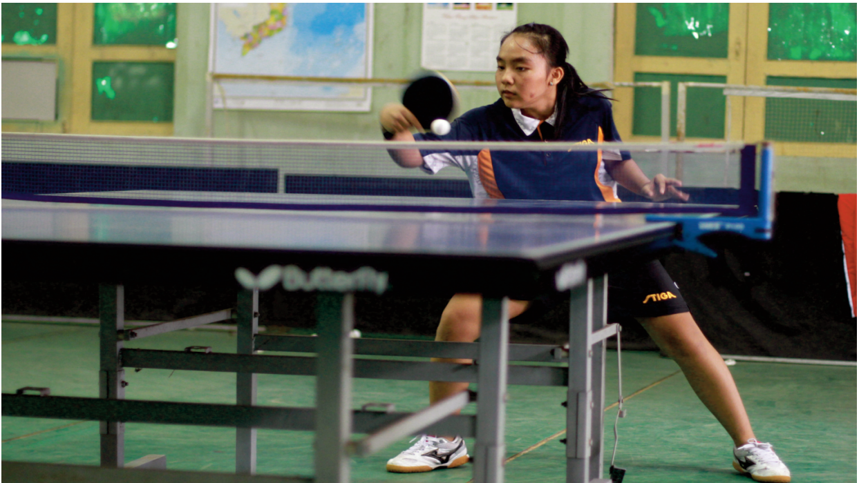
Trong tập luyện và thi đấu Bóng bàn, sức mạnh tốc độ có vai trò và ý nghĩa quan trọng trong cả tấn công và phòng thủ

Ở giai đoạn ban đầu thông qua 5 test kiểm tra trình độ SMTĐ của 2 nhóm là không có sự khác biệt ( t_{\text{tính}} < t_{\text{bảng}} = 2.048 ở ngưỡng xác suất P > 0.05 ), điều đó chứng tỏ là SMTĐ của nam sinh viên Bóng bàn chuyên ngành GDTC ở cả 2