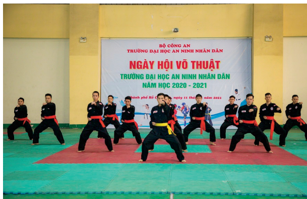
Cùng với võ thuật CAND, nhiều môn võ thuật hiện đang được phát triển mạnh mẽ tại Học viện An ninh nhân dân