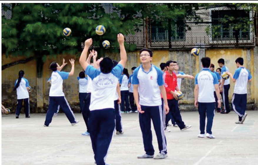
Học tập tích cực môn học GDTC và tập luyện thể thao ngoại khóa là giải pháp hữu hiệu phát triển thể lực cho sinh viên