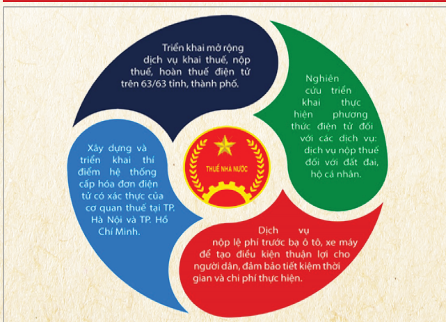
HÌNH 1: KẾT QUẢ NỔI BẬT VỀ HIỆN ĐẠI HÓA TRONG LĨNH VỰC THUẾ