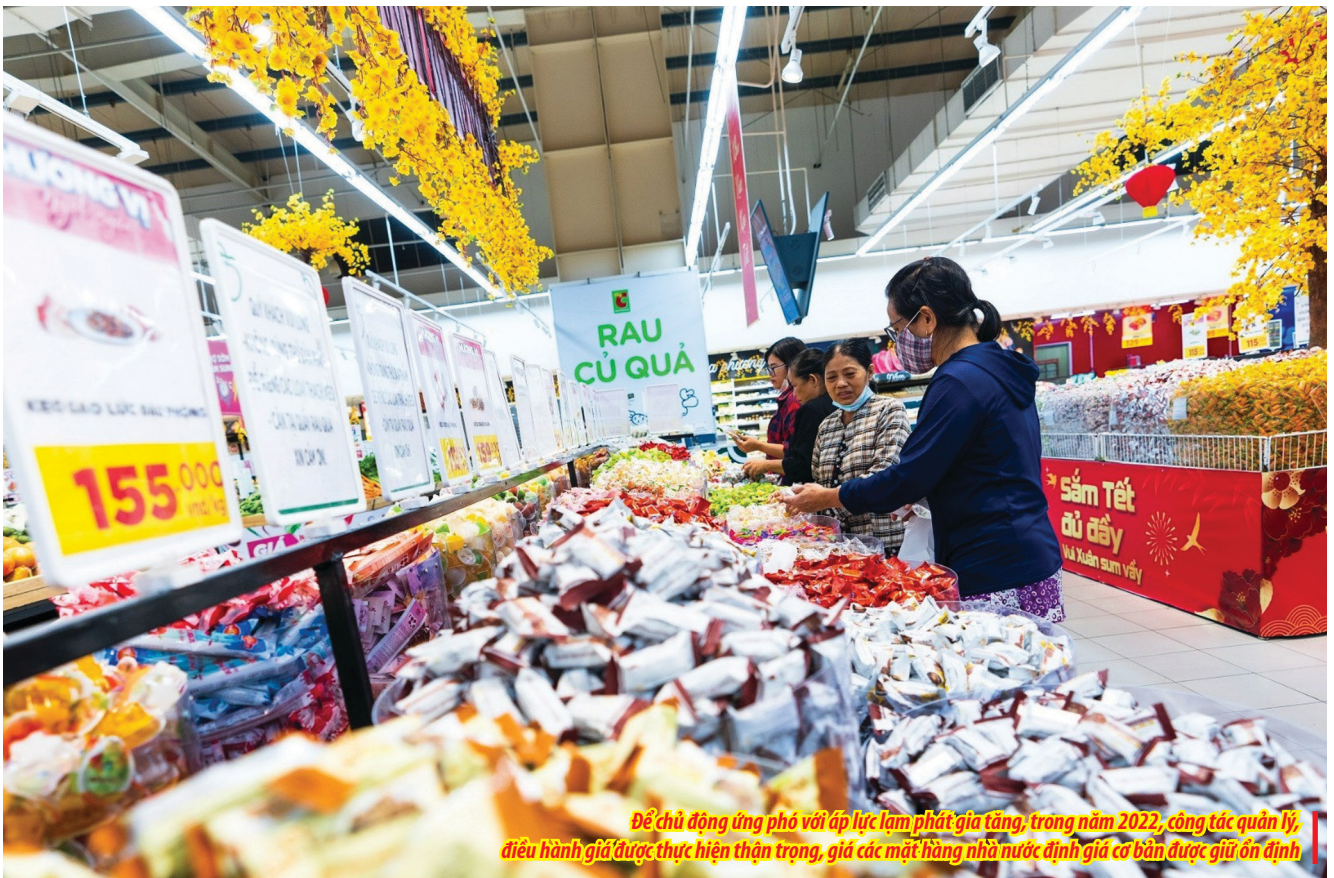
Để chủ động ứng phó với áp lực lạm phát gia tăng, trong năm 2022, công tác quản lý, điều hành giá được thực hiện thận trọng, giá các mặt hàng nhà nước định giá cơ bản được giữ ổn định

Năm 2022, bối cảnh thế giới tiếp tục có nhiều biến động phức tạp, khó lường như: Xung đột Nga-Ukraine, chính sách “Zero COVID” của Trung Quốc, lạm phát tăng cao ở Mỹ, châu Âu... Những yếu tố này không chỉ tác động đến tình hình kinh tế - xã hội, mà còn đặt ra nhiều thách thức đối với công tác quản lý, điều hành giá của Việt Nam. Tuy nhiên, dưới sự chỉ đạo sát sao của Chính phủ, Thủ tướng Chính phủ, Bộ Tài chính đã chủ động phối hợp với các bộ, ngành kịp thời có các “kịch bản”, giải pháp điều hành, quản lý giá chặt chẽ, nhờ đó, năm 2022, kiểm soát lạm phát đạt mức dưới 4% theo mục tiêu đề ra. Trên cơ sở đó, năm 2023, Bộ Tài chính sẽ phối hợp với các bộ, ngành quản lý, điều hành giá thận trọng, linh hoạt.