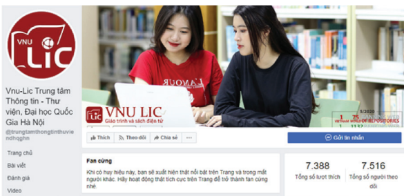
Hình 6. Lượng người dùng theo dõi trang Facebook của Vnu-Lic

Facebook cho phép người dùng quảng cáo và tương tác với mọi người. Khi một người thích Trang (Page), họ có thể theo dõi bài viết trên Page. Bạn cũng có thể sử dụng thông tin chi tiết về khu vực địa lý và nhân khẩu học của những người thích Page để đưa ra quyết định quảng cáo các SPDV và tăng lượt truy cập đến các nguồn tài nguyên mà cơ quan TT-TV đang có. Facebook là một trong những công cụ lan truyền tin tức quyền lực nhất trên internet vào lúc này. Do đó, tất cả những thông tin được chia sẻ trên Facebook đều có thể được chia sẻ một cách dễ dàng, nhanh chóng và rộng rãi.