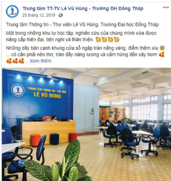
Hình 4. Khảo sát ý kiến bạn đọc thông qua Facebook của Thư viện tỉnh Đồng Tháp.

kèm hình ảnh minh họa nhằm giảm thiểu sự nhàm chán cho NDT. Tăng lượt bình luận và đánh giá để NDT cảm thấy hứng thú trả lời, tham gia thảo luận chung.