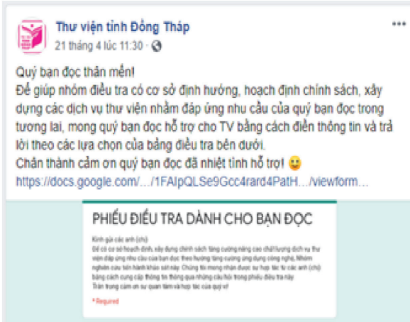
Hình 3. Khảo sát ý kiến bạn đọc thông qua Facebook của Thư viện tỉnh Đồng Tháp.

những điều chỉnh kịp thời nhằm nâng cao chất lượng SPDV của mình đưa ra. Việc duy trì hoạt động này thường xuyên và liên tục tạo nên cơ sở để hiểu sâu hơn về nhu cầu của NDT, dựa vào đó có những chính sách phù hợp để đáp ứng nhu cầu tin.