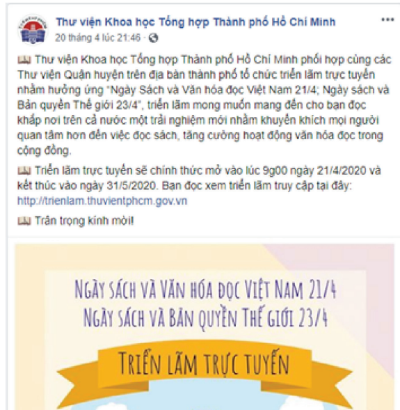
Hình 5. Dẫn nguồn tài nguyên số qua Facebook của Thư viện KHTH Hồ Chí Minh

Điểm truy cập tới các nguồn lực thông tin là cung cấp thông tin trực tuyến về các tài nguyên số hóa và là công cụ giúp người kết nối, truy cập tới các nguồn lực ấy nhằm nâng cao hiệu quả khai thác các bộ sưu tập ở dạng in truyền thống cũng như các CSDL trực tuyến. Cho phép NDT truy cập bộ sưu tập qua mạng internet.