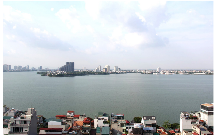
...và Hồ Tây hôm nay