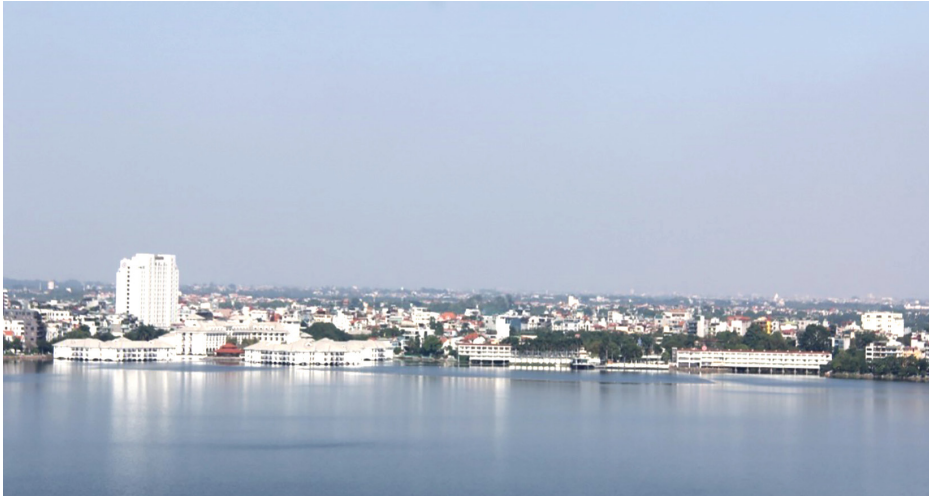
InterContinental Hotel Westlake và Khách sạn Thăng Lợi bên mặt hồ (Phía sau là Khách sạn Sheraton)