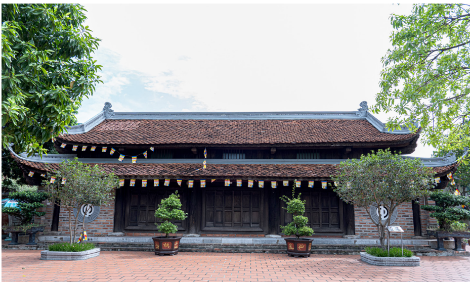
Chùa Kim Liên

Bên cạnh silhouette, bức tranh kiến trúc Hồ Tây còn được tạo bởi dòng chảy - ngôi nhà - những con phố cũ bên bờ Nam thông qua quan sát những chuỗi mái nhà phố hay thường được gọi là mặt đứng thứ năm.