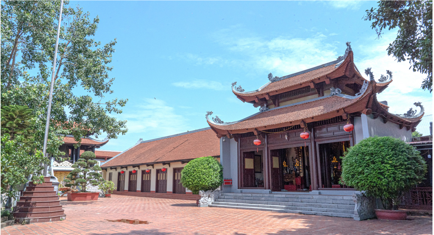
Phủ Tây Hồ

bài toán giao thông cơ giới tiếp cận. Nên chăng, giao thông cơ giới được tổ chức lại, trên cơ sở Quy hoạch phân khu Hồ Tây 2014, theo các tuyến vành đai bên ngoài: Thụy Khuê, Lạc Long Quân, Âu Cơ, Nghi Tàm, Đường Thanh Niên.