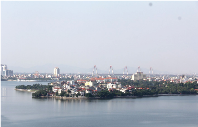
Bán đảo Nghi Tâm 10 năm trước...