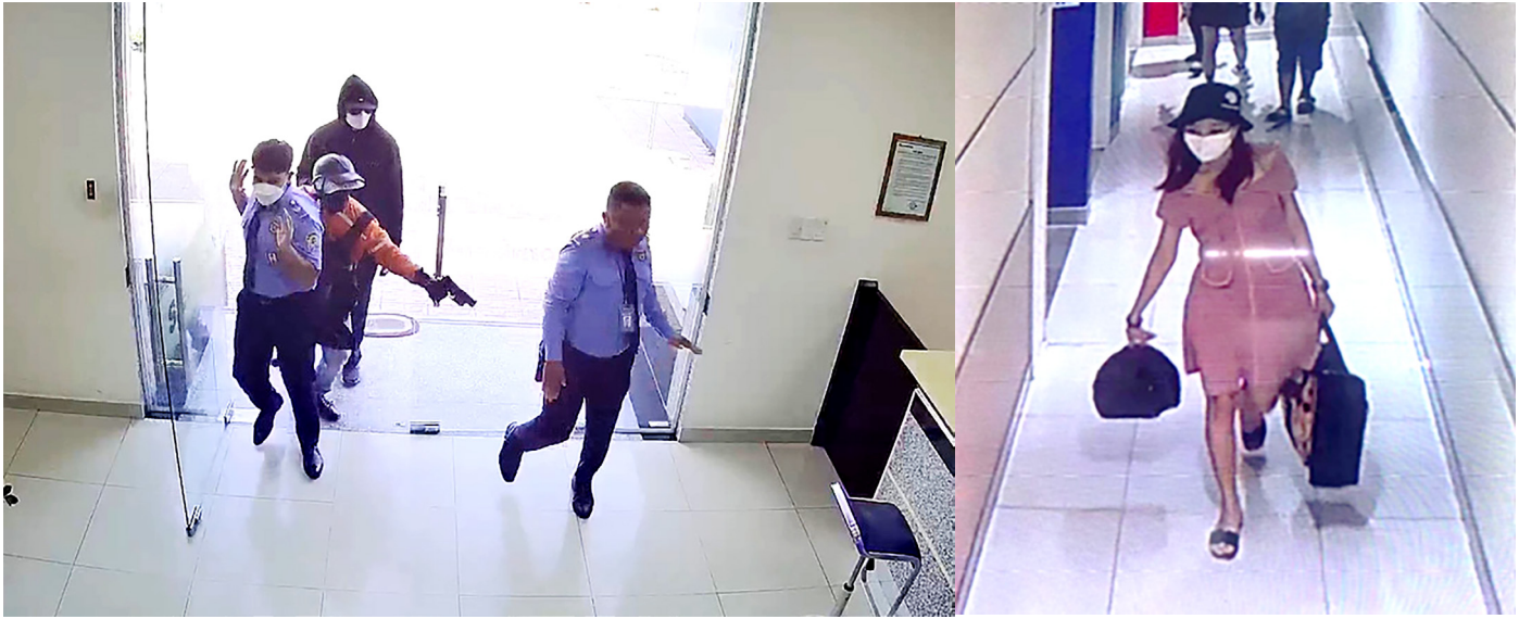
Kẻ cướp có súng khống chế bảo vệ, để vào cướp ở ngân hàng ở Hóc Môn Kẻ cướp là nữ giới ở vụ cướp Techcombank Quận Tân Phú, TPHCM