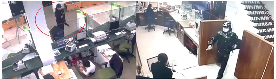
Kẻ cướp dùng súng khống chế nhân viên qua vách ngăn yếu và thấp. Kẻ cướp đi qua cửa mở trực tiếp vào quầy giao dịch ngân hàng ở Cửa Lò

Phạm vi bài viết chủ yếu vận dụng phương pháp định tính bàn về các giải pháp trong lĩnh vực Kiến trúc - Nội thất. Các giải pháp công nghệ như: kỹ thuật thông tin, camera, gắn chip vào bó tiền hay ngăn kéo kỹ thuật hai ngăn... giải pháp huấn luyện nhân sự sẽ phải đề cập trong một tài liệu khác.