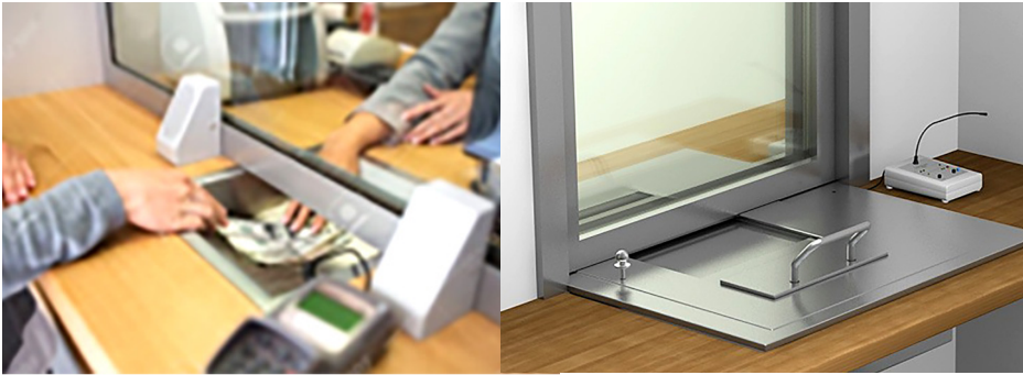
Chuyển tiền qua khe hở dưới vách kính của vách ngăn quầy Ngăn kéo thép đặt dưới vách ngăn kính của quầy để chuyển tiền