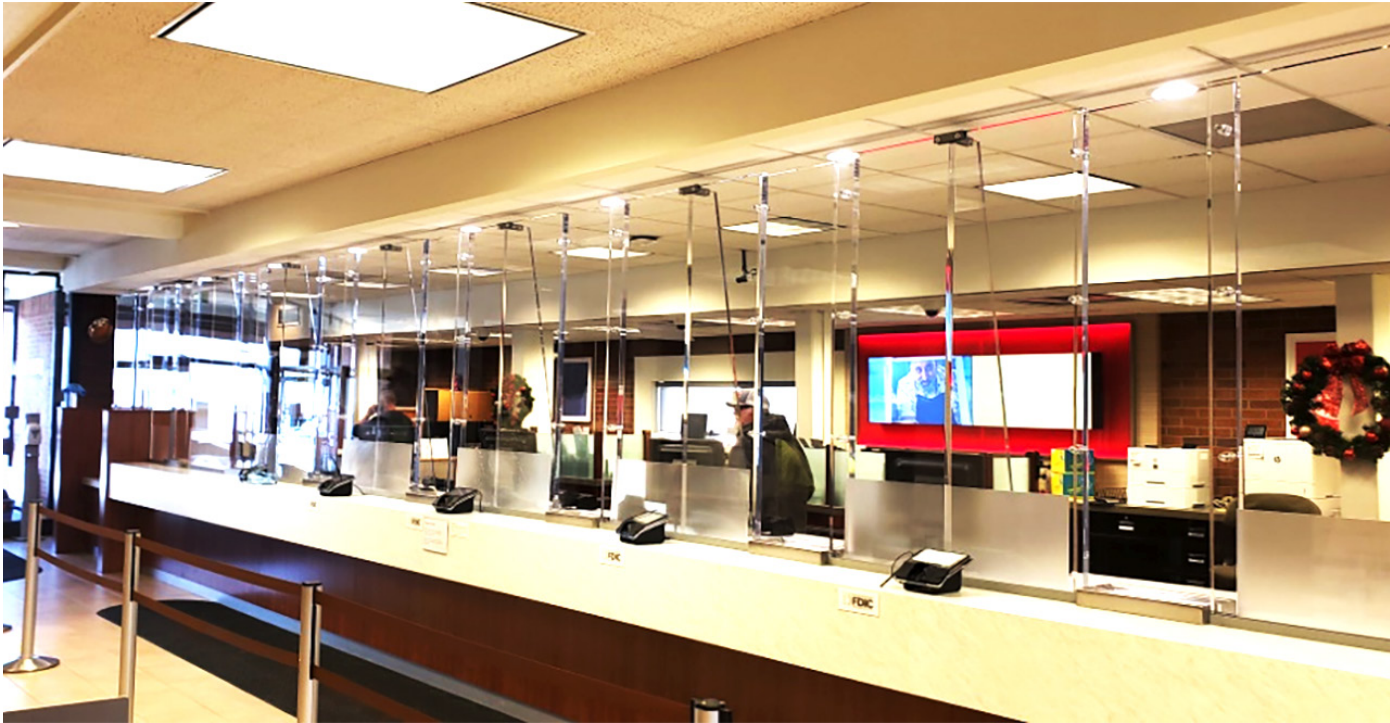
Sử dụng Vách kính cao, ngăn cách không gian Khách hàng và không gian Nhân viên giao dịch