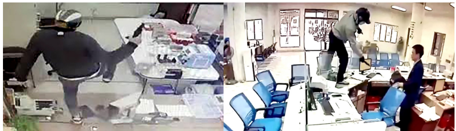
Kẻ cướp dễ dàng leo lên đứng trên quầy giao dịch Ngân hàng Cửa Lò, Nghệ A. Kẻ cướp dễ dàng bước qua vách kính của quầy giao dịch Ngân hàng Cửa Lò