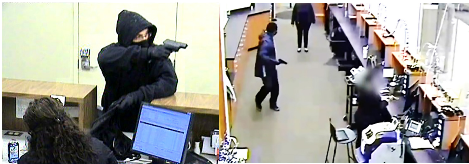
Kẻ cướp có súng đeo mặt nạ vào cướp tại ngân hàng Bank of America tại County Route, Pine Island ngày 24/11

Xu hướng sử dụng công nghệ để thực hiện hành vi phạm tội