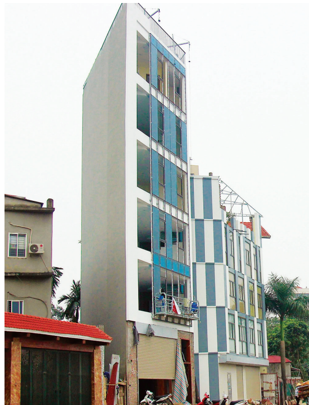
Thiếu lý luận, kiến trúc Việt Nam phát triển một cách khá tự phát

Gần 50 năm từ ngày đất nước thống nhất, kiến trúc Việt Nam đã có những bước phát triển ngày càng tiệm cận với vị thế cần có. Khai thác các thành tựu đạt được, sàng lọc loại bỏ các hướng phát triển còn lệch lạc, lý luận kiến trúc Việt Nam sắp ra đời và sẽ liên tục được hoàn thiện giúp nền kiến trúc sớm đậm đà hỗn cốt dân tộc. Các tiêu chuẩn, quy định pháp luật xây dựng cần được cập nhật, bổ sung tiến kịp với nhịp điệu của thực tiễn sẽ tháo gỡ các trói buộc, tạo thêm các điều kiện, động lực để kiến trúc sư Việt Nam có môi trường hành nghề trong sạch, lành mạnh. Chúng ta cùng tin tưởng và mong chờ vào một nền kiến trúc mà “cơ thể” của nó được kiện toàn bởi các tiêu chuẩn xanh, “linh hồn” của nền kiến trúc ấy được dẫn dắt bởi một hệ thống lý luận hoàn chỉnh. Ở đó, người thiết kế được tạo điều kiện thoải sức sáng tạo bởi các nền tảng pháp lý tường minh. Xác định được các mục tiêu để cùng hành động, chúng ta cùng bước vào một mùa xuân vươn mình của đất nước, mùa xuân mới của kiến trúc Việt Nam./