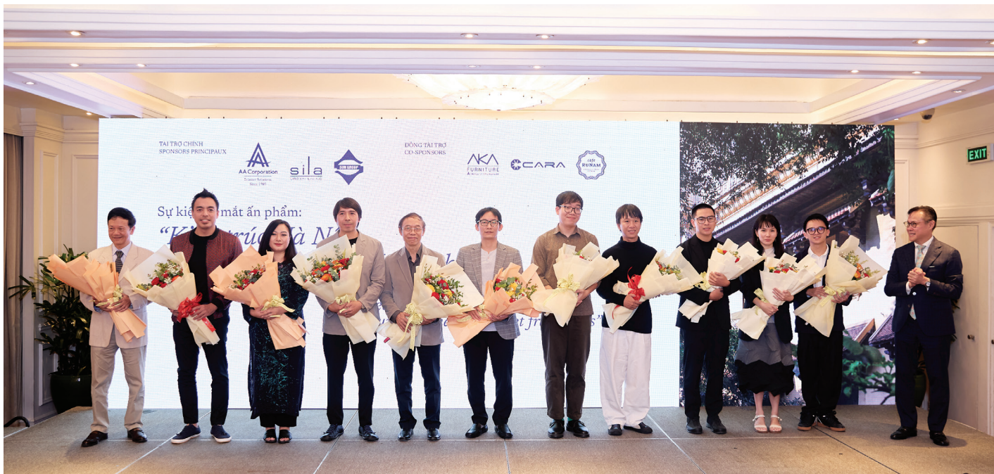
Đội ngũ làm nên cuốn sách "Kiến trúc Hà Nội - Giao thoa văn hóa Việt - Pháp" kiến trúc tại sự kiện

Từ nền tảng cội nguồn kiến trúc Thăng Long - Hà Nội xưa ở thế kỷ XVIII trở về trước với thành quách "lối xưa xe ngựa hồn thu thảo", kết nối vùng dân dã "kẻ chợ"; sự chuyển mình hội nhập, tiếp thu lối nghệ thuật tinh hoa của kiến trúc phương Tây ở thời kỳ Pháp thuộc như Beaux-Arts, Art Déco, Gothique... cho đến sự giao thoa nhuần nhuyễn giữa tinh hoa kiến trúc thế giới với văn hóa bản địa... mỗi cứ liệu lịch sử kiến trúc được các tác giả diễn giải một cách hết sức nhẹ nhàng, dễ hiểu và giàu cảm xúc. Độc giả sẽ thấy trong sự tráng lệ vốn là điển hình cho phong cách Beaux-Arts của Phủ Chủ tịch, lại có những họa tiết trang trí đậm chất cổ truyền Việt Nam. Hay những công trình Art Déco điển hình như tòa nhà Ngân hàng Nhà nước cũng khéo léo được thêm nếm vào đó nét Việt tinh hoa... Những giao thoa này, dù là chấm phá, cũng đủ cho thấy văn hóa và kiến trúc Việt có giá trị và ảnh hưởng nhất định tới những kiến trúc sư và nền kiến trúc có bề dày lịch sử đáng ngưỡng mộ như kiến trúc Pháp.