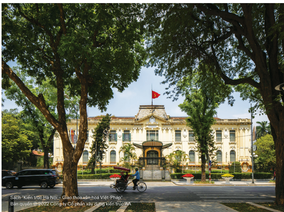
Sách "Kiến trúc Hà Nội - Giao thoa văn hoá Việt-Pháp" Bản quyền ©2022 Công ty Cổ phần xây dựng kiến trúc AA

Đi qua mỗi phần của cuốn sách, người đọc vừa thấy quen, vừa thấy lạ. Quen bởi những công trình đó vốn đã quá đỗi thân thuộc trong mỗi khoảnh