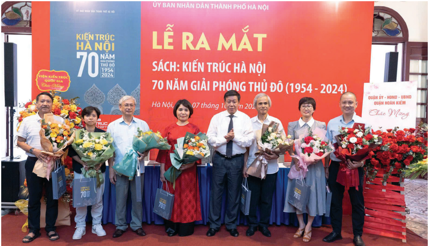
Ban biên tập cuốn sách Kiến trúc Hà Nội - 70 năm Giải phóng Thủ đô (1954 - 2024)