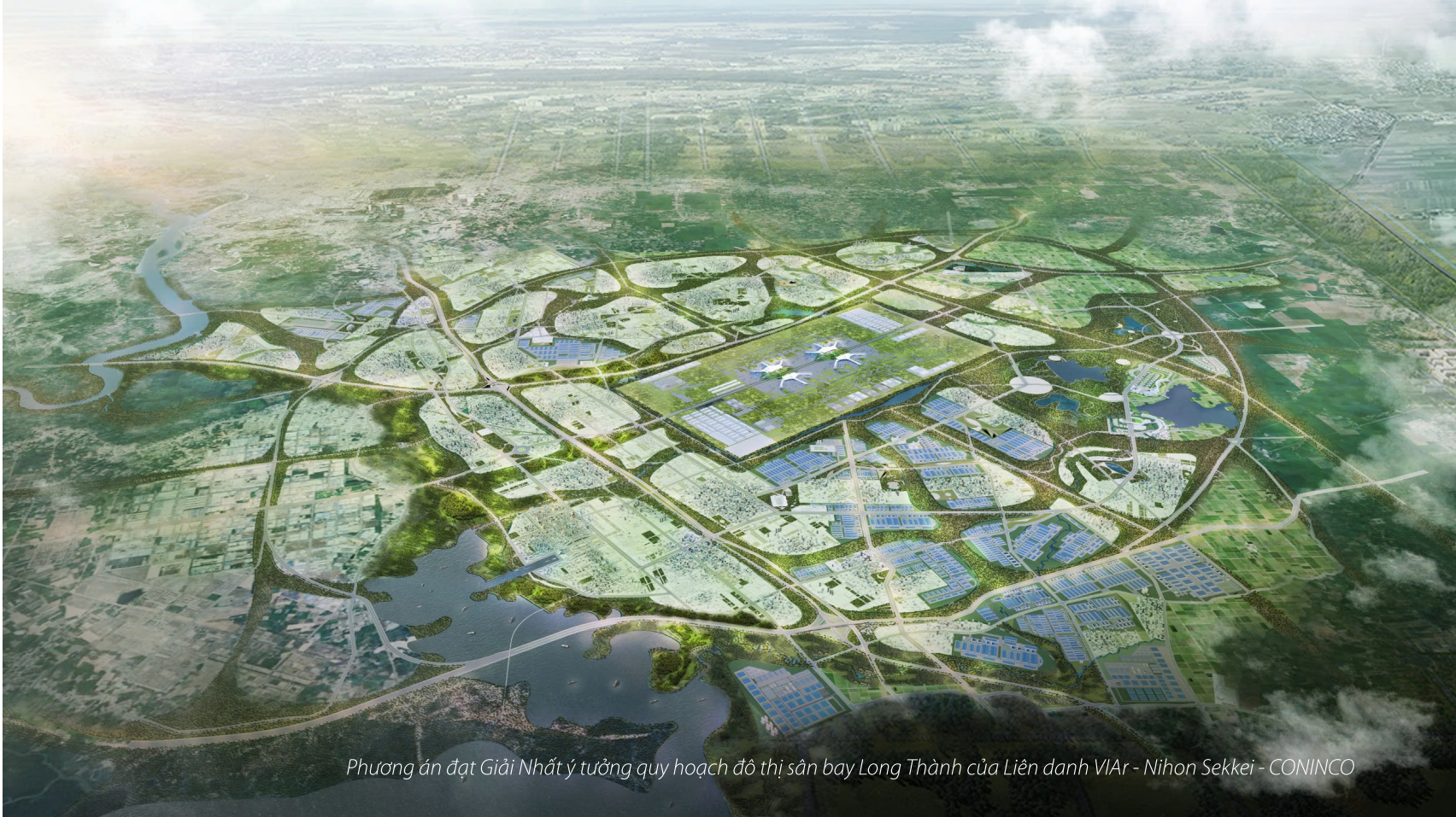
Phương án đạt Giải Nhất ý tưởng quy hoạch đô thị sân bay Long Thành của Liên danh VAr - Nihon Sekkei - CONINCO