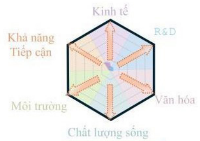
HO CHI MINH + LONG THANH

Mô hình thành phố song sinh TPHCM và Long Thành Aerotropolis, hợp tác - tận dụng thế mạnh của mình để tạo ra sự cộng hưởng, tăng cường năng lực cạnh tranh toàn cầu