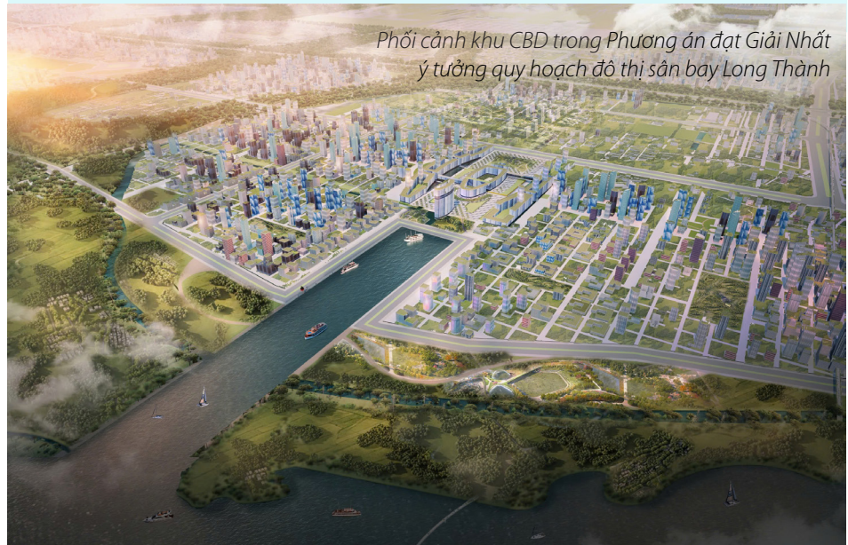
Phối cảnh khu CBD trong Phương án đạt Giải Nhất ý tưởng quy hoạch đô thị sân bay Long Thành

In the context of globalization, when travel speed and connectivity expansion become key factors, Long Thanh International Airport plays an important role in enhancing the national aviation capacity, opening up great opportunities for Vietnam to integrate more deeply into the comprehensive economy, entering an era of integration and strong development. The twin cities model between Ho Chi Minh City and Long Thanh will integrate strategies for balanced growth. In which, both cities reinforce each other's strengths while addressing common challenges. Ho Chi Minh City's economic dynamism and cultural depth will be complemented by Long Thanh's future-oriented urban design and sustainability. Together, they will create the image of a globally connected and competitive region./.