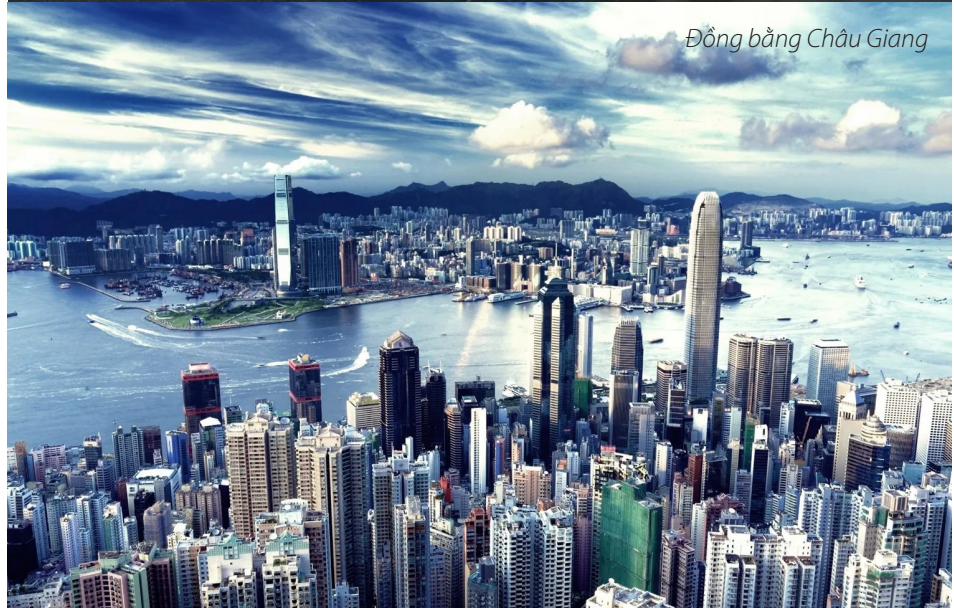
Đồng bằng Châu Giang