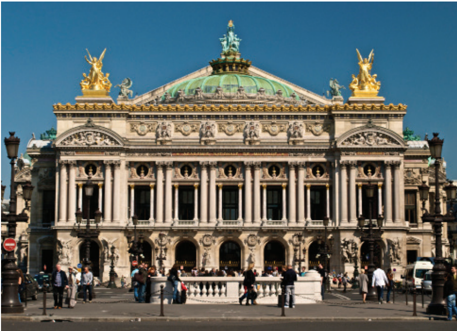
Paris Opera facade

Đọc theo đường Regent, có nhiều tòa nhà mang đặc điểm của những hình thức cổ điển như Doric, Ionic và Corinthian. Các tòa nhà như số 232, 242-4, 176-7 chứa các yếu tố như lan can ban công vòm hình thức Corinthian, đá stucco và các cột Ionic đứng tự do.