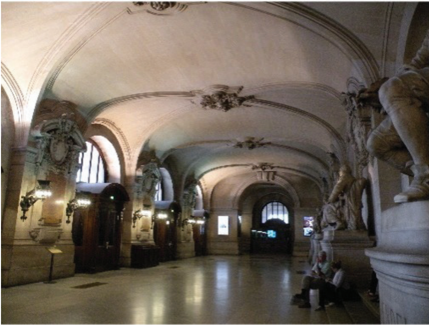
The Grand Vestibule, Paris Opera