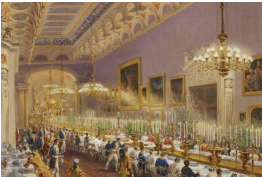
Phòng tranh ở cung điện Hoàng gia