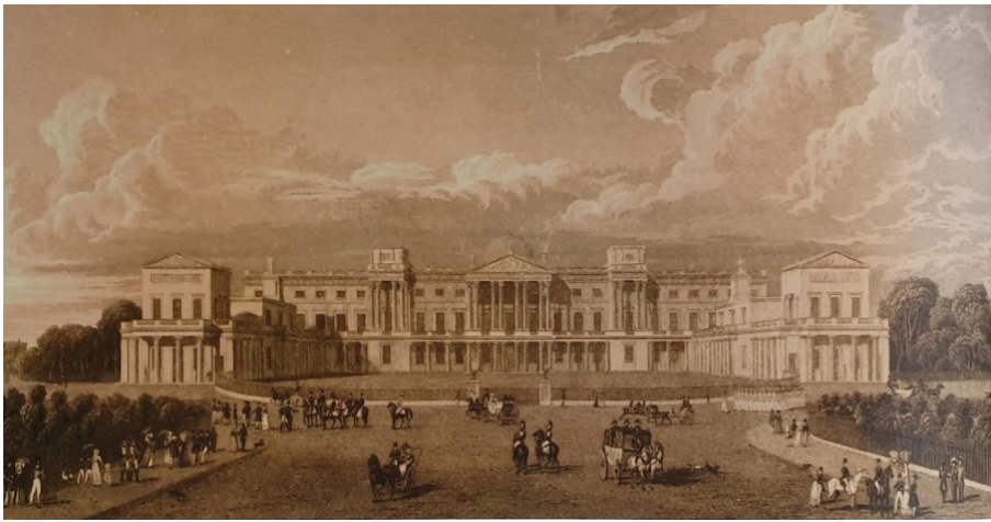
Cung điện Hoàng gia (Buckingham Palace) thiết kế bởi John Nash