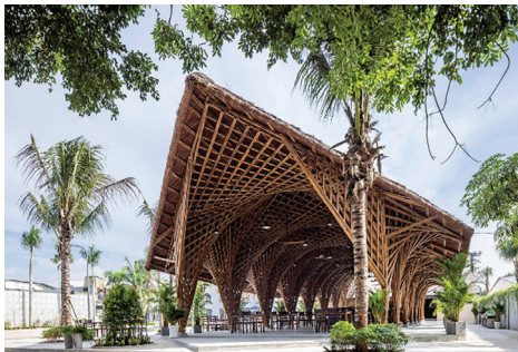
Hình 3. Nhà hàng hải sản Keeng

Đối với Việt Nam, khoảng cách giữa tiềm năng và năng lực thực tế ứng dụng TKTS không phải do thiếu công cụ, mà chủ yếu do thiếu nền tảng lý luận hệ thống và thiếu mô hình đào tạo tích hợp. Việc tiếp tục để TKTS chỉ được tiếp cận như một kỹ năng phần mềm sẽ tạo ra những người dùng thụ động, không đủ khả năng giải quyết các bài toán thiết kế mới. Ngược lại, nếu được đặt đúng vị trí là một năng lực tư duy nền tảng, TKTS sẽ trở thành một đóng góp thực chất cho nghiên cứu, đào tạo và thực hành kiến trúc Việt Nam đương đại./.