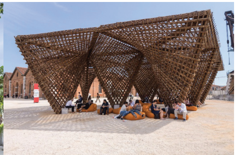
Hình 4. Nhũ tre