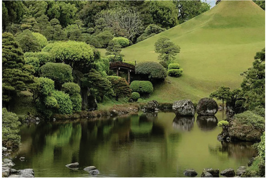
Hình 1. Vườn Tsukiyama tại Suizen-ji Jōju-en (Kumamoto) với đôi nhân tạo, ao và cầu cong, minh họa cách mô phỏng núi - nước trong phong cách vườn hồ đảo Nhật Bản.

Trong giai đoạn Nara-Heian, giáo lý Tịnh Độ được thể hiện rõ qua mô hình vườn ao chisen đặt trước Chính Điện (Kondō) hoặc Điện thờ A Di Đà (Amida-dō). Tại các chùa như Yakushiji và Hokkeji Jōdō-in, ao sen như một biểu tượng không gian của “Bát