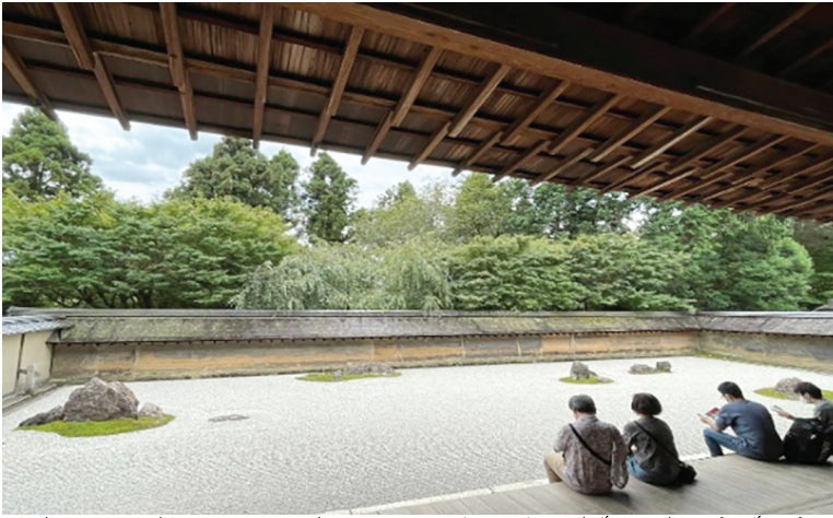
Hình 2. Vườn đá Karesansui chùa Ryōan-ji (Kyoto), với bố cục đá - sỏi tối giản, chỉ được chiêm ngưỡng từ hiên gỗ, thể hiện rõ tinh thần Thiền tông hướng nội.