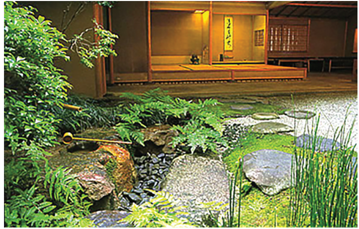
Hình 4. Vườn trà Chaniwa với lối đi bằng đá, bể đá tsukubai và hàng rào tre, là không gian chuyển tiếp từ đời sống thường nhật sang nghi thức trà đạo theo tinh thần Thiền. Nguồn: Campbelltown-Koshigaya Sister Cities Association Inc. (2020).

kubai - bể đá thấp buộc người dùng phải cúi mình rửa tay; cổng nhỏ phủ rêu; cây phong hoặc các loài cây lá rụng; cùng các tảng đá nhỏ, bụi cây thấp dẫn tới nhà trà có diện tích khoảng 7-8 m 2 (Hình 4). Hàng rào tre bao quanh giúp che khuất tầm nhìn ra bên ngoài, tạo cảm giác tách biệt với không gian thế tục.