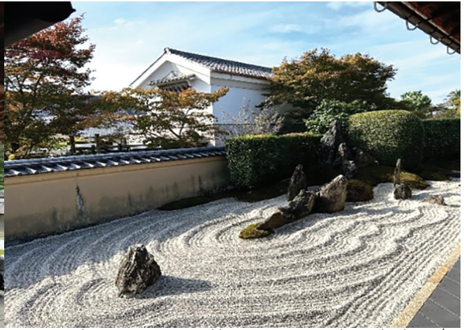
Hình 3. Một góc vườn khô tại Daisen-in dùng đá đen trắng tượng trưng “hồ vượt sông” (thuộc chùa Daitok Zu-ji, Kyoto).

sân vườn, thổi luồng sinh khí mới vào khu vườn Thiền truyền thống Nhật Bản, góp phần hồi sinh Karesansui trong khi vẫn bảo tồn bản chất ban đầu của nó. Ngày nay, vườn Zen Nhật Bản có thể được tìm thấy trên khắp Nhật Bản và tiếp tục là nguồn cảm hứng, chiêm nghiệm cho mọi người trên khắp thế giới.