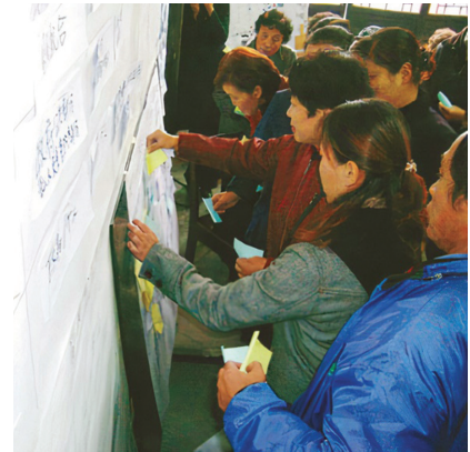
Cư dân cộng đồng văn hóa Yangzhou biểu quyết để xác định các vấn đề quan trọng cần giải quyết