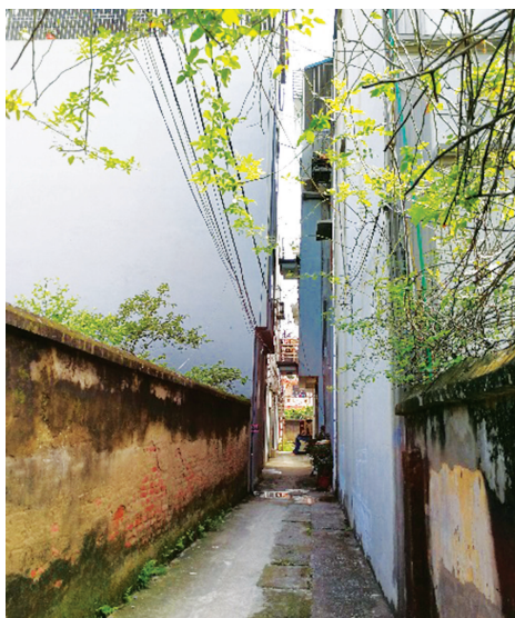
Kiến trúc nhà ống xuất hiện tràn lan trong những con ngõ nhỏ của làng

Phương pháp thiết kế và quy hoạch có sự tham gia của cộng đồng ngày càng trở nên phổ biến ở nước ngoài, là một hình thức biểu hiện của lý thuyết tương hỗ thẩm thấu trong thực tiễn. Cách tiếp cận này nhấn mạnh rằng các KTS, nhà quy hoạch và người dân đều cần tham gia vào quá trình lập kế hoạch, thiết kế, và điều phối các nhu cầu của chính người