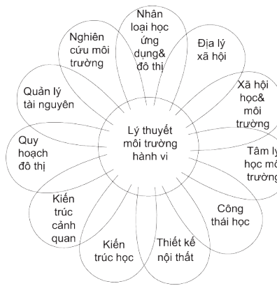
Các lĩnh vực nghiên cứu của lý thuyết Môi trường hành vi