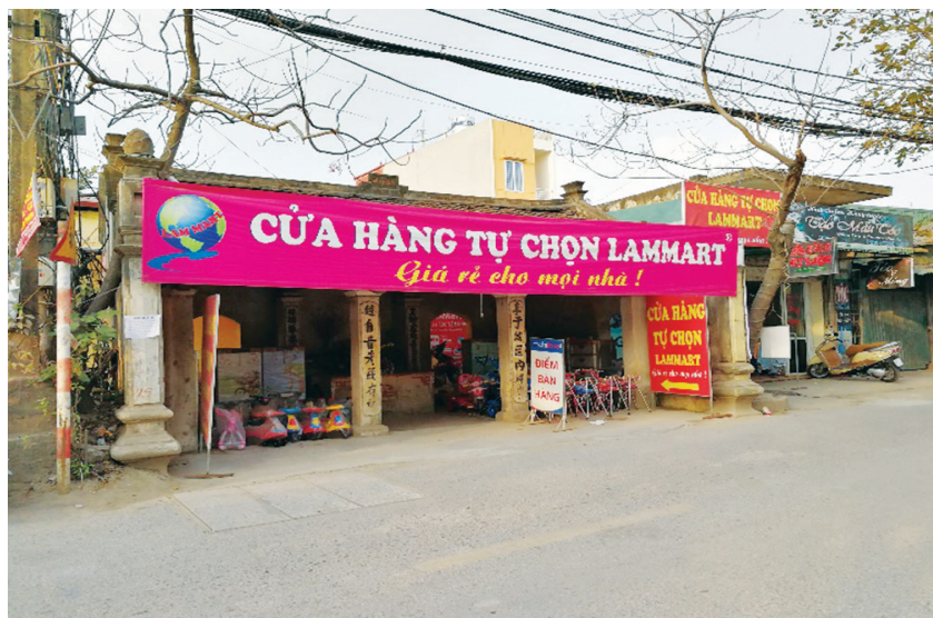
Một công trình tâm linh trong làng bị lấn chiếm làm nơi buôn bán