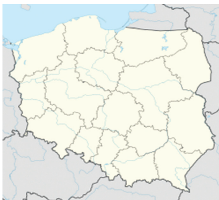
Bản đồ TP Kraków

Kraków có rất nhiều tuyến tàu điện chạy trên đường, nhiều cửa hiệu ăn uống trên hè phố và nhiều chim bồ câu bay nhảy. Vẻ đẹp của