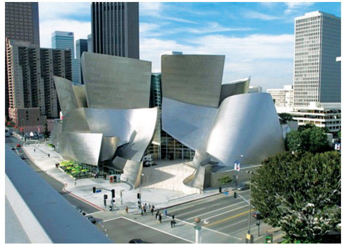
Quảng trường nhà hát Walt Disney - đại lộ Grand Avenue, Los Angeles, Mỹ