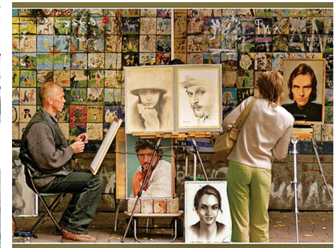
Họa sỹ vẽ tranh Chân dung trên đường Phố cổ Arbat

lính Hồng quân, mũ áo, quân hàm, quân hiệu, huân, huy chương và cả những thanh kiếm của những sĩ quan từng xông pha trận mạc...; dường như nơi đây muốn gửi đến du khách bốn phương một thông điệp về nước Nga còn nhiều hiện vật chứng minh cho kỳ tích chống xâm lăng của cha ông họ).