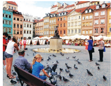
Quảng trường nhỏ trong Khu phố cổ Arbat