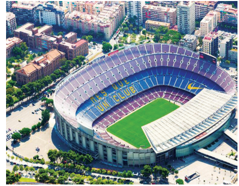
Sân vận động Camp Nou ở Barcelona