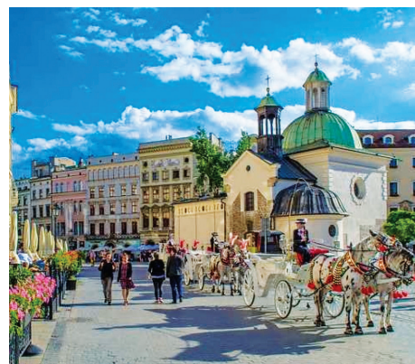
Không gian đường phố cổ trong TP Kraków