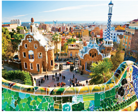
Góc kiến trúc "cổ tích" của TP Barcelona.

- Theo dự án lập năm 2000, hình dạng của quảng trường này không có gì thay đổi, nhưng quá trình tranh luận đã dẫn tới một kết luận khá bất ngờ: với quy mô rộng như vậy, Rambla del Raval rất phù hợp với một hình dạng quảng trường trong khu Ciutat Vella. Đó là một phiên bản có tính đương đại của Pla - không gian mở tại điểm giao cắt của những trục đường lớn ở Barcelona từ thời Trung cổ và là địa điểm được ưa chuộng trong đời sống của người dân thành thị - trong đó có Pla de la Boqueria.