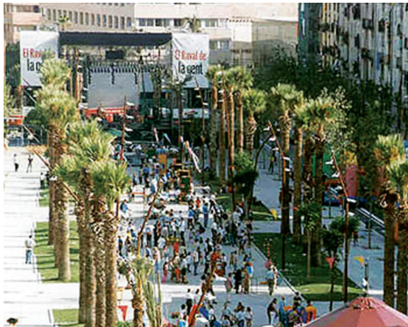
Phố đi bộ La Rambla đông đúc náo nhiệt & Tượng nghệ thuật trên đường phố của Barcelona