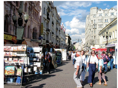
Không gian trưng bày sách, báo trên mặt đường Phố cổ Arbat