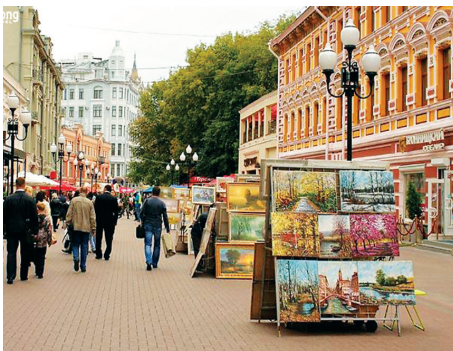
Trưng bày Tranh vẽ của các họa sĩ trên mặt đường Phố cổ Arbat