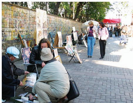
Họa sỹ vẽ và bán tranh phong cảnh trên đường Phố cổ Arbat