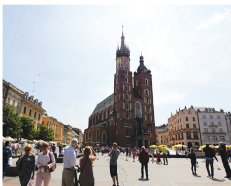
Thánh đường St. Mary's Basilica xây dựng TK XII l giữa Quảng trường phố cổ Kraków