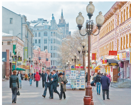
Không gian đi bộ và du ngoạn trên đường Phố cổ Arbat

Nơi đây thực sự là không gian văn hóa có giá trị cho dân cư TP và du khách thập phương, việc bán hàng hóa thương mại là thứ yếu, chỉ để làm cho khu vực thêm sinh động, hoạt động sôi nổi hơn. Không gian chợ ở đây khá độc đáo, bởi suốt con phố người ta không bán hàng tiêu dùng, mà chỉ bán các loại hàng lưu niệm độc đáo (Hàng lưu niệm nhiều nhất là các loại trang phục của người