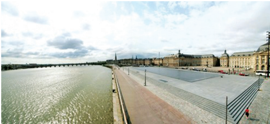
Quảng trường Quinconces Bordeaux, Cộng hòa Pháp

- Việc bố trí một tuyến xe điện chạy viển theo trục không gian này đã tạo nên một sự thay đổi sâu sắc về mặt tổ chức lại lưu lượng giao thông và khiến cho tuyến đường này mang diện mạo gần gũi với đô thị hơn.