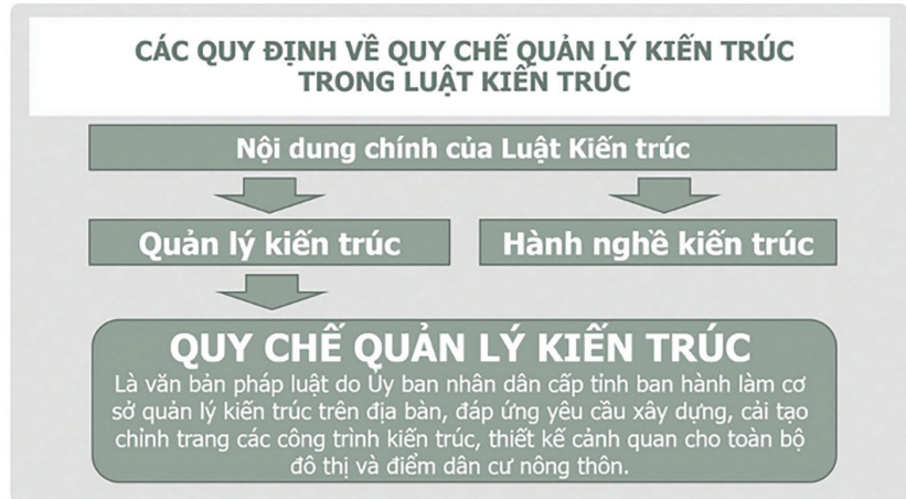
Khái niệm QCQLKT tại Luật Kiến trúc

Sau khi Luật Kiến trúc có hiệu lực, phần lớn các địa phương trên cả nước đã ban hành Quy định phân công, phân cấp tổ chức lập thẩm định, phê duyệt QCQLKT trên địa bàn tỉnh để phù hợp với điều kiện đặc thù của mỗi địa phương, điều này đã góp phần đẩy nhanh quá trình xây dựng và ban hành QCQLKT ở các địa phương. Tuy nhiên, trong quá trình xây