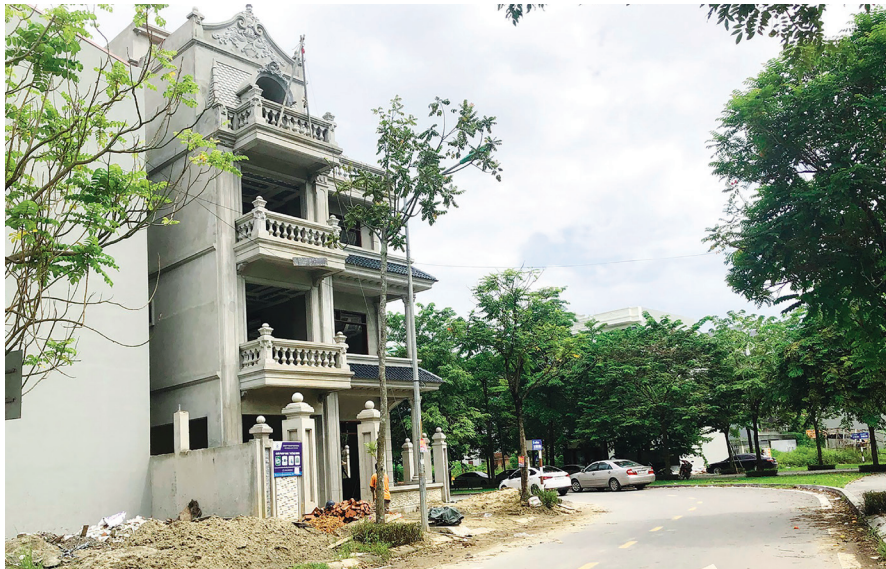
Các địa phương đang gặp nhiều khó khăn trong công tác xây dựng Quy chế quản lý kiến trúc

một văn bản pháp luật - Luật Kiến trúc. Bản sắc văn hóa dân tộc trong kiến trúc gồm đặc điểm, tính chất tiêu biểu, dấu ấn đặc trưng về điều kiện tự nhiên, kinh tế - xã hội, văn hóa, nghệ thuật; thuần phong mỹ tục của các dân tộc; kỹ thuật xây dựng và vật liệu xây dựng, được thể hiện trong công trình kiến trúc, tạo nên phong cách riêng của kiến trúc Việt Nam. UBND cấp tỉnh có trách nhiệm tổ chức nghiên cứu, khảo sát, đánh giá và quy định nội dung yêu cầu về bản sắc văn hóa dân tộc trong quy chế quản lý kiến trúc.