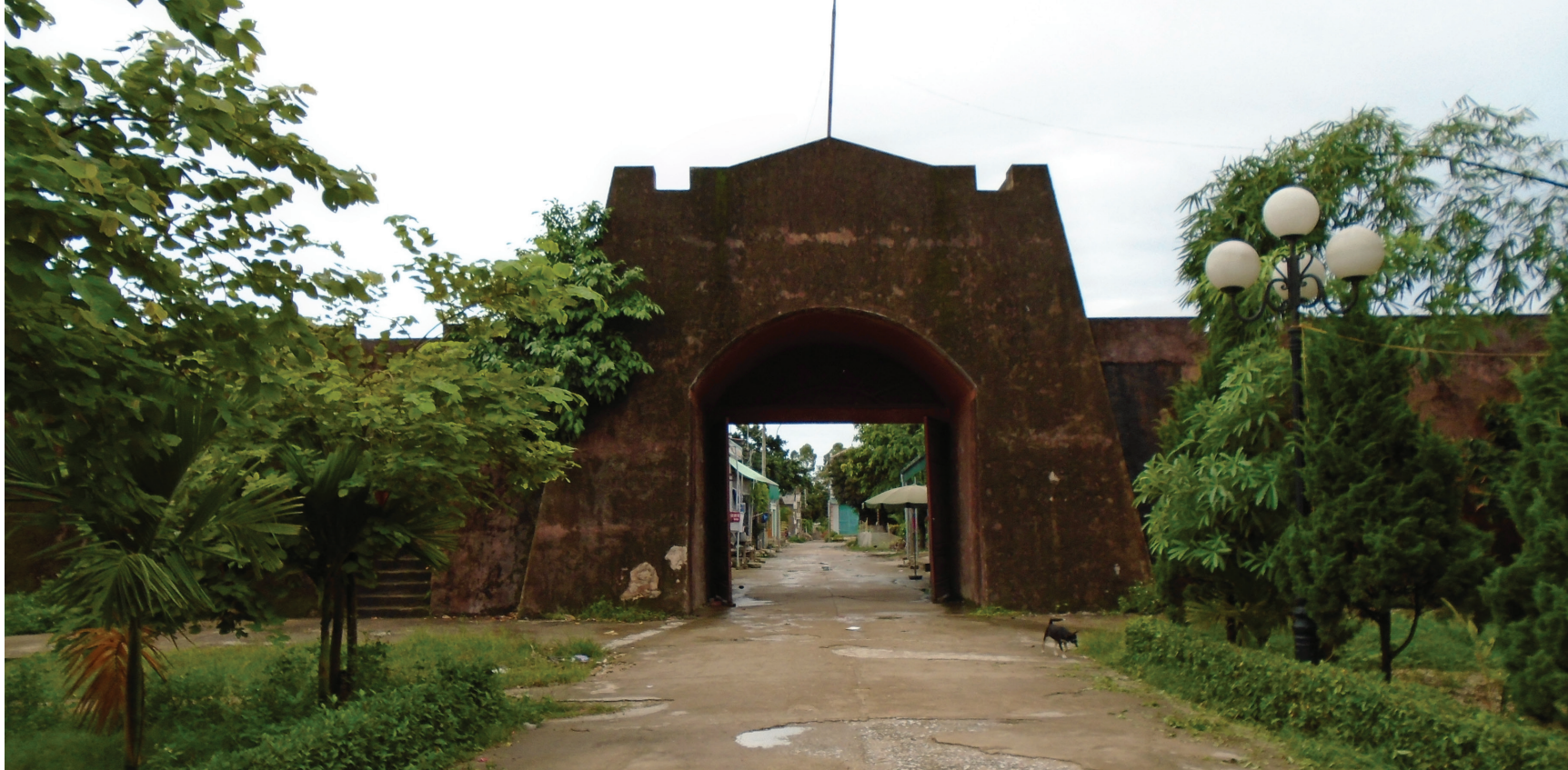
Thành Bản Phủ, xã Hưng Đạo, thành phố Cao Bằng