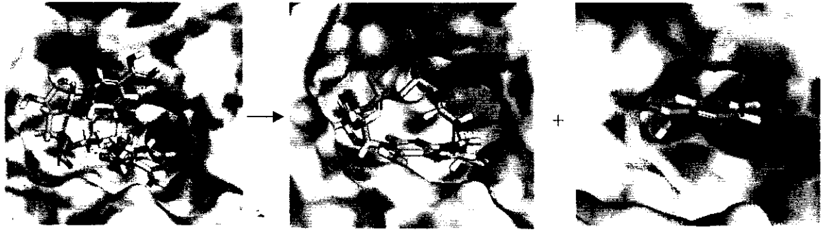
Hình 3: Minh họa cấu hình có năng lượng cực tiểu của phức E146F với lần lượt NAD, cADP, NA và cơ chế phản ứng vòng hóa

giữa thể đột biến và NA càng lớn thì phản ứng vòng hóa càng thuận lợi. Cơ chế vòng hóa cADPR được minh họa trên hình 3. Cơ chế này phù hợp với cơ chế do Qun Liu và cộng sự đề xuất [10] trên cơ sở thực nghiệm.