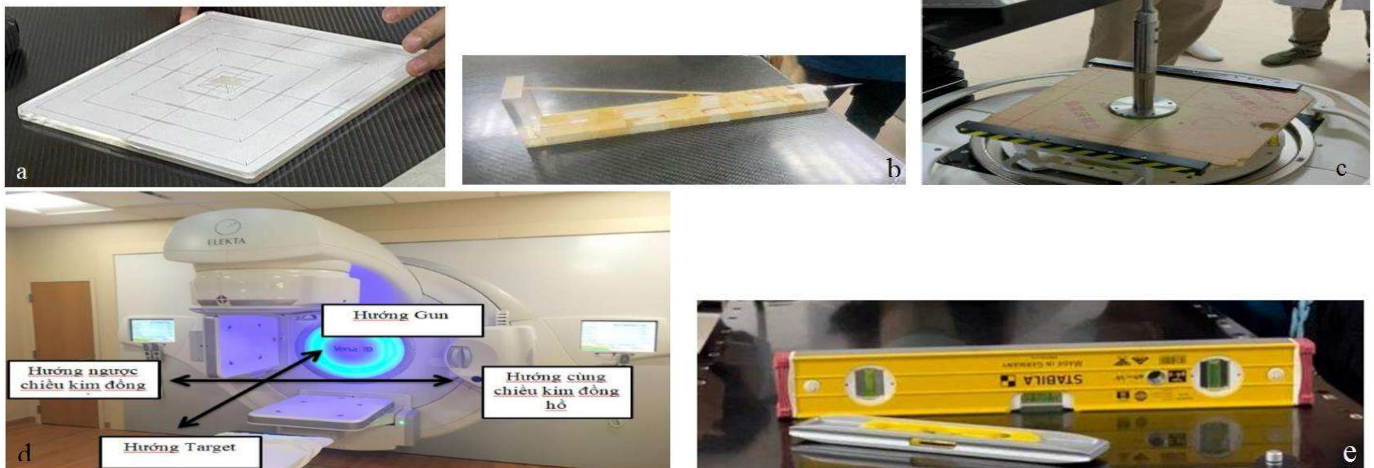
Hình 2 Các hình ảnh thiết bị (a) kiểm tra độ đồng tâm, (b) góc quay của máy LINAC, (c) định vị điểm (Pointer) gắn vào gantry, (d) định vị điểm (Pointer) đặt trên bàn bệnh nhân, (e) Thước thủy

2.1.3 Dụng cụ kiểm tra độ đồng tâm và góc quay cho gantry: bao gồm 2 loại thiết bị, đầu tiên là “dụng cụ định vị điểm (pointer) gắn vào gantry” (Hình 2c.) là một trụ sắt dài có phần chân hình vuông, thiết bị này sẽ được gắn trên khay phụ kiện của LINAC. Đầu pointer có thể di chuyển ra vào một khoảng cách nhỏ, trên pointer sẽ có vạch chỉ thị khi đầu thiết bị này di chuyển đến \text{SSD} = 100 \text{ cm} . Thiết bị thứ hai là “dụng cụ định vị điểm (pointer) đặt trên bàn bệnh nhân” (Hình 2b.) là một dụng cụ được thiết kế bởi các nhà vật lý y khoa tại cơ sở, thiết bị này đại diện cho điểm đồng tâm cơ khí của máy trong quá trình kiểm tra. Tổng sai số dụng cụ này đóng góp khi đo chênh lệch trường sáng và chênh lệch góc cơ khí lần lượt là 0,1 mm và 0,1 độ.