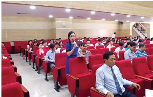
Các CB-GV tham gia thảo luận với Giáo sư Briesen trong hội nghị.

ban và hơn 200 CB-GV trường ĐH Cửu Long. Tại buổi báo cáo các CB-GV Trường được giáo sư Briesen hướng dẫn tiến trình viết lược khảo tài liệu từ việc định vị vấn đề nghiên cứu, kế thừa các nghiên cứu trước thông qua các ưu khuyết điểm hay cách chọn lọc các tài liệu hữu dụng cho nghiên cứu của mình. Lưu tài liệu tham khảo một cách logic, có hệ thống phục vụ công trình nghiên cứu dài hạn như luận án Tiến sĩ hay nghiên cứu cấp nhà nước cũng