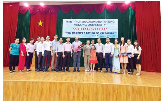
Giáo sư Briesen chụp hình lưu niệm với CB-GV sau hội nghị

Ngoài ra, CB -GV còn được tham gia thảo luận, được Giáo sư giải đáp các vấn đề vướng mắc trong khâu viết Lược khảo Tài liệu. Báo cáo chuyên đề lần này là một trong những hoạt động khoa học góp phần giúp CB -GV Trường ĐH Cửu Long nâng cao kỹ năng, tiếp cận phương pháp hữu ích trong lĩnh vực làm nghiên cứu khoa học của mình.