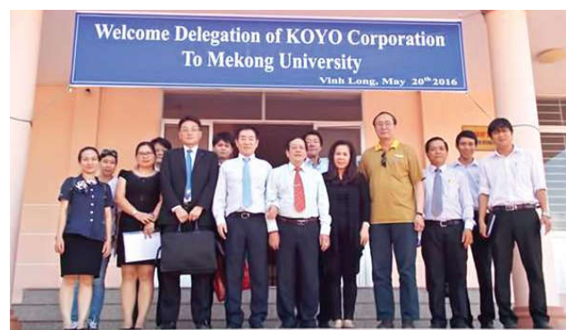
Hai đơn vị giao lưu chụp ảnh lưu niệm