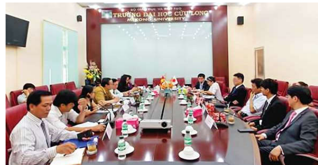
Lãnh đạo hai đơn vị làm việc

Sau buổi làm việc, nhà trường đã hướng dẫn Đoàn tham quan một số cơ sở vật chất và khảo sát địa điểm để có hướng thiết kế lắp đặt cụ thể hệ thống năng lượng tiết kiệm điện cho Đại học Cửu Long.