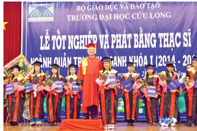
Trao bằng tốt nghiệp cho 43 tân Thạc sĩ chuyên ngành Quản trị Kinh doanh khóa 1 niên khóa 2014-2016