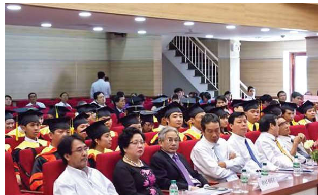
Quý đại biểu cùng các tân Thạc sĩ về dự lễ tốt nghiệp

Tới dự buổi lễ trao bằng có: ông Trần Hoàng Tự-Phó Chủ tịch UBND tỉnh Vĩnh