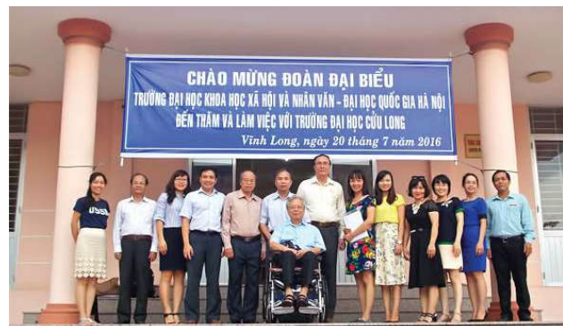
Và giao lưu chụp ảnh