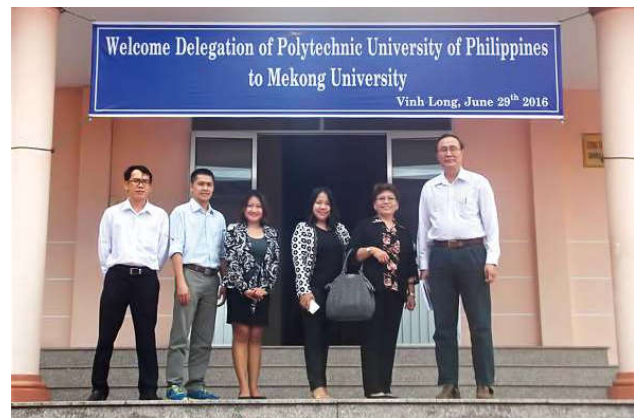
Lãnh đạo Trường tặng quà và chụp hình kỷ niệm cùng Đoàn Đại biểu trường Đại học Bách khoa Philippines