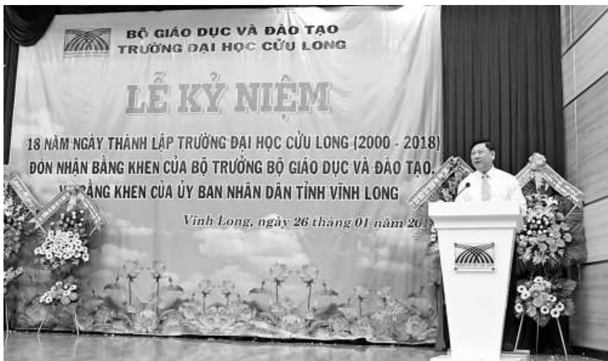
TS. Trần Văn Rón - UV. BCH Trung ương Đảng, Bí thư Tỉnh ủy tỉnh Vĩnh Long phát biểu chúc mừng những thành tích đạt được của trường Đại học Cửu Long