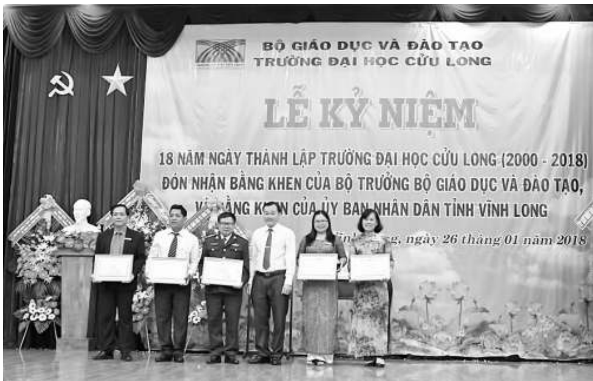
Các cá nhân nhận Bằng khen của UBND tỉnh Vĩnh Long.