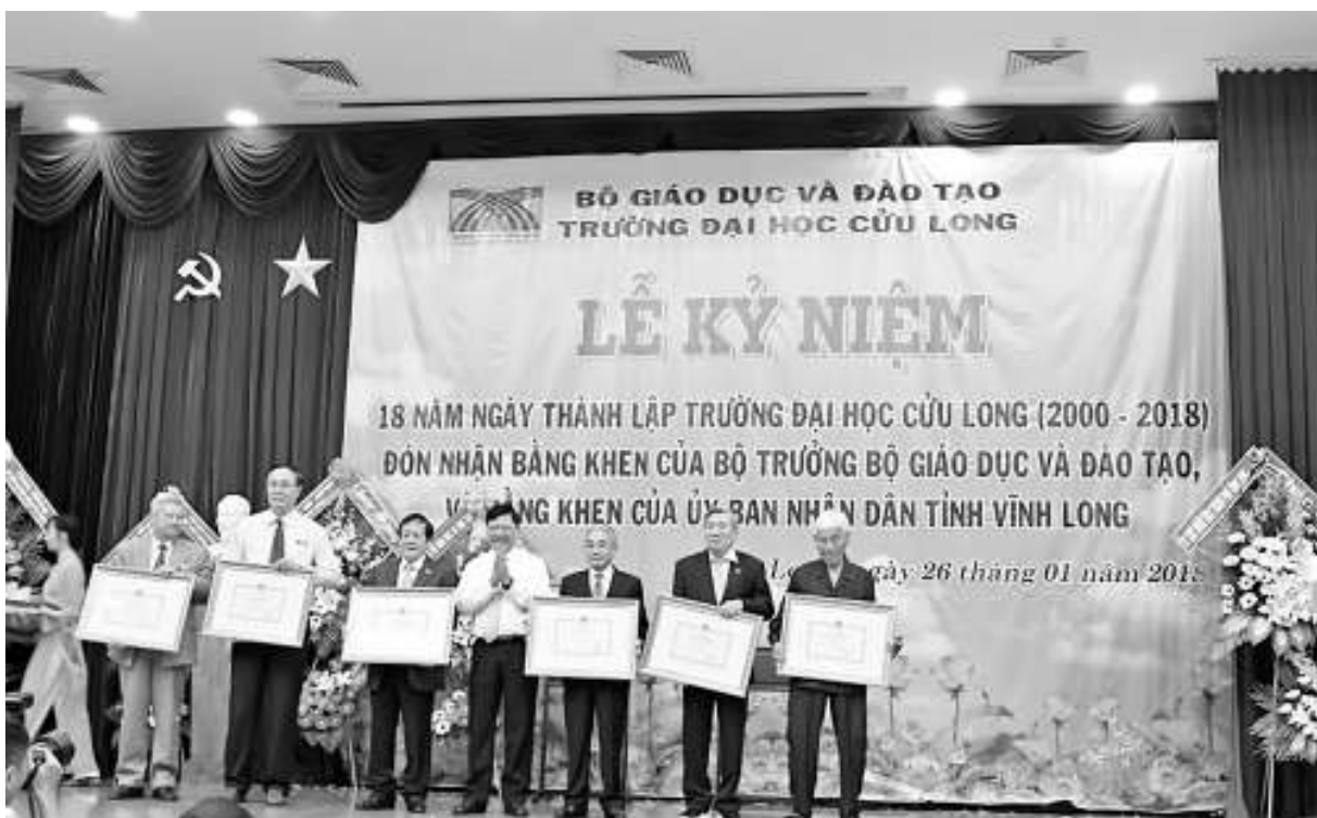
Các cá nhân nhận Bằng khen của Bộ Giáo dục & Đào tạo.