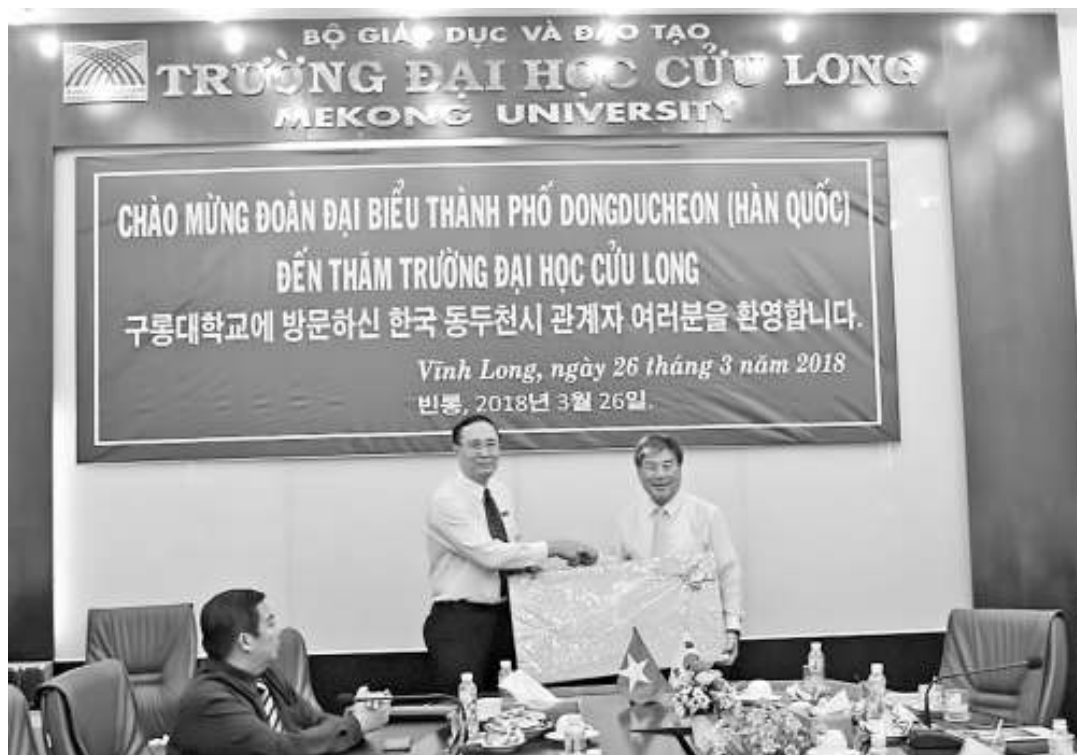
Hai bên tặng quà lưu niệm.