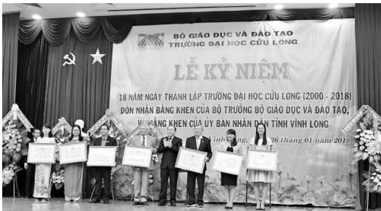
Đại diện các Tập thể nhận bằng khen của Bộ Giáo dục & Đào tạo.