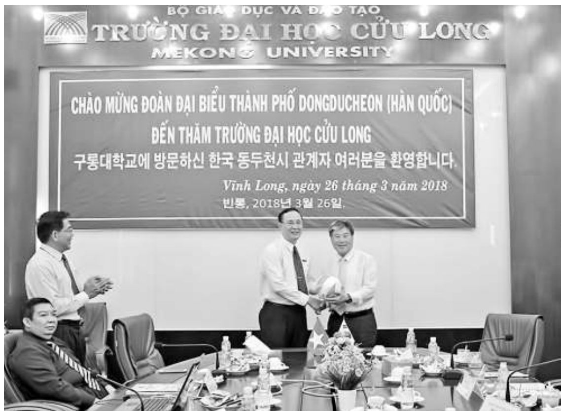
Hai bên tặng quà lưu niệm.