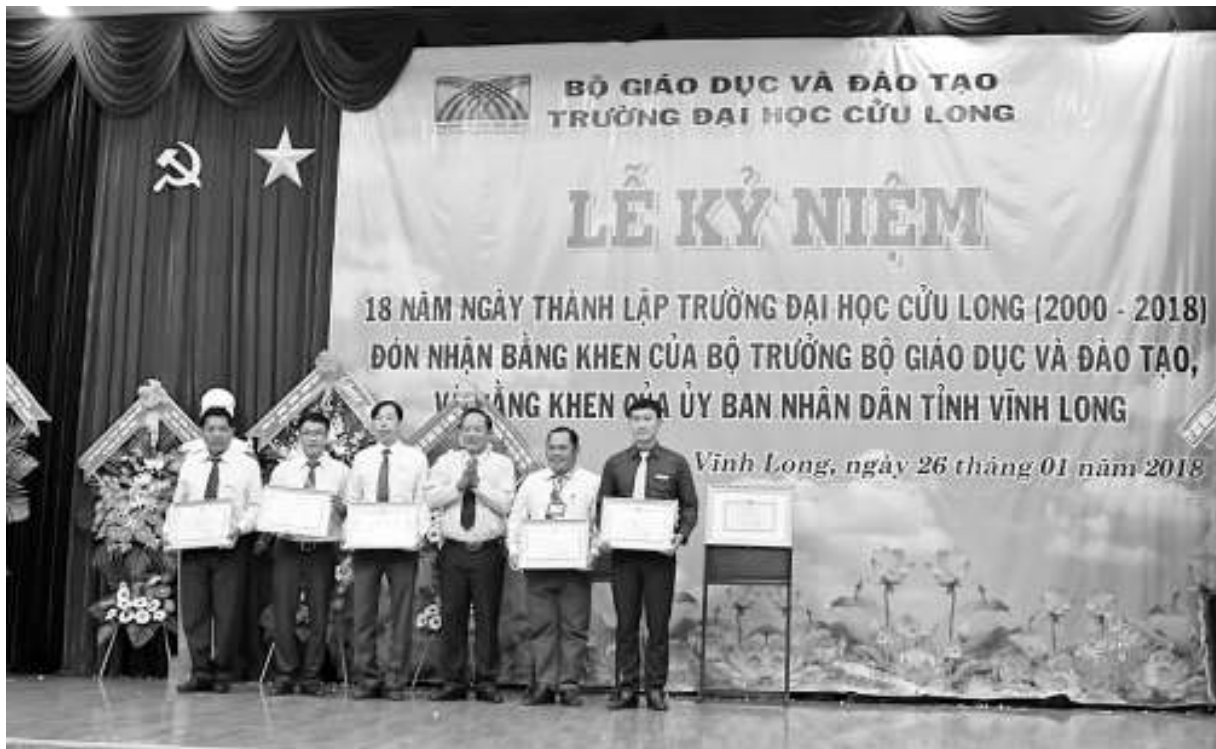
Đại diện các Tập thể nhận Bằng khen của UBND tỉnh Vĩnh Long.