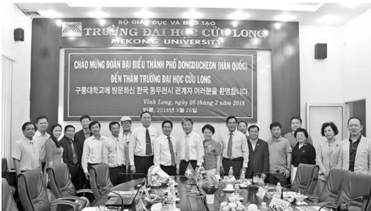
Chụp hình lưu niệm.