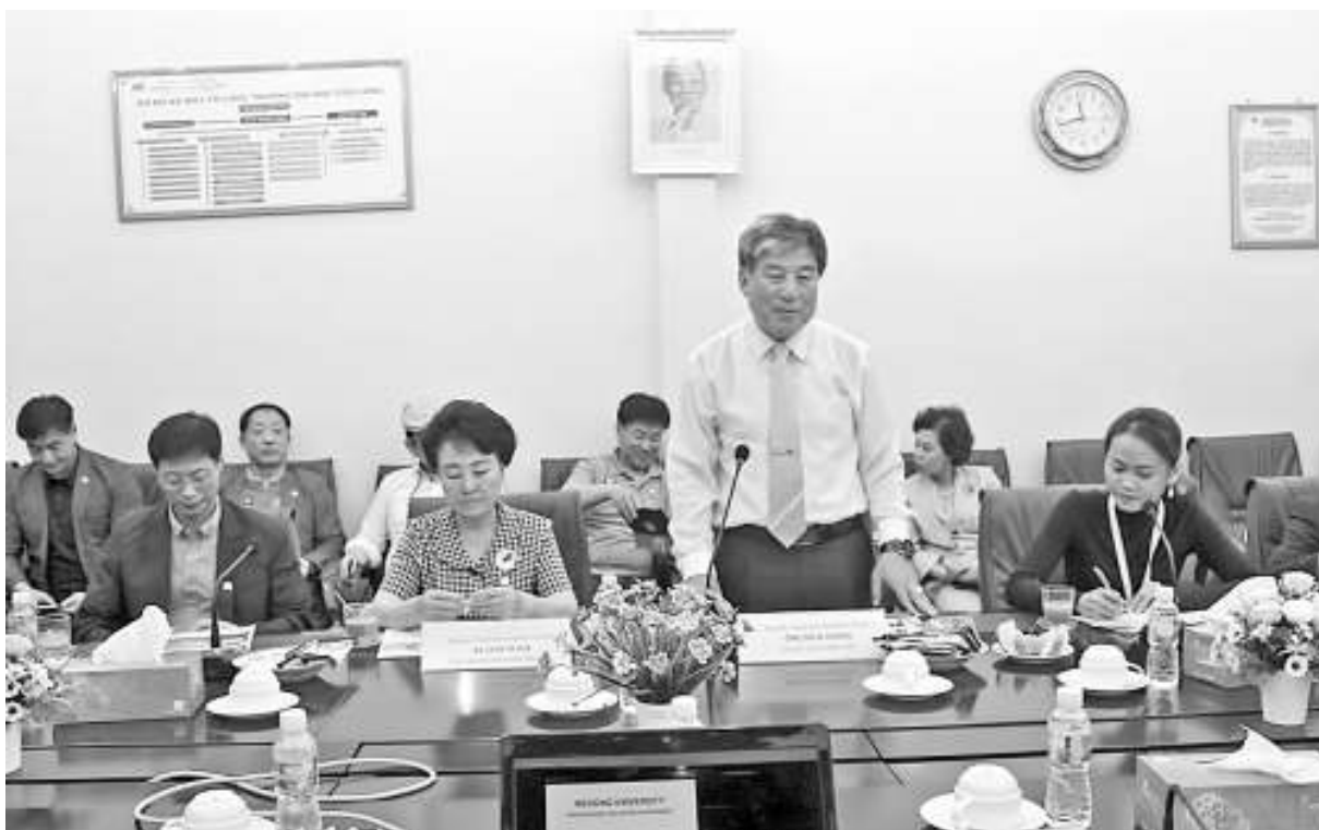
Ông Oh Se Chang Chủ tịch UBND Thành phố DONGDUCHEON phát biểu trong buổi làm việc

Ông Oh Se Chang Chủ tịch UBND Thành phố DONGDUCHEON (Hàn Quốc) phát biểu cảm ơn Nhà trường đã có buổi đón tiếp nồng nhiệt, trang trọng và phía Thành phố DONGDUCHEON sẽ tạo điều kiện thuận lợi và là cầu nối cho các Doanh nghiệp của Thành phố DONGDUCHEON có những bước hợp tác với trường Đại học Cửu Long để cùng nhau phát triển.