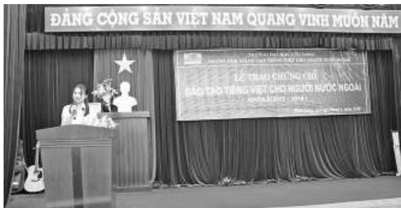
Bạn PhongSai Luongmala đại diện cho các bạn nhận chứng chỉ phát biểu

Lào son sắt. Sau buổi Lễ hôm nay các em trở về trường Cao đẳng Y tế Đồng Tháp để tiếp tục học chuyên môn các em cần tiếp tục rèn luyện tiếng Việt để có thể học tốt chuyên môn của mình sau này về phục vụ đất nước Lào trở thành người công dân Lào tốt”.