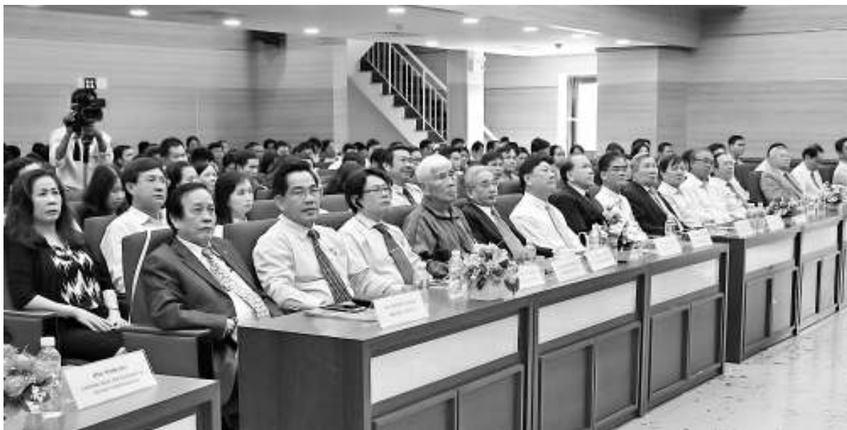
Quang cảnh buổi lễ

S áng ngày 26/01/2018 trường Đại học Cửu Long tổ chức Lễ kỷ niệm 18 năm ngày thành lập Trường và đón nhận bằng khen của Bộ trưởng Bộ Giáo dục & Đào tạo, bằng khen của UBND tỉnh Vĩnh Long.