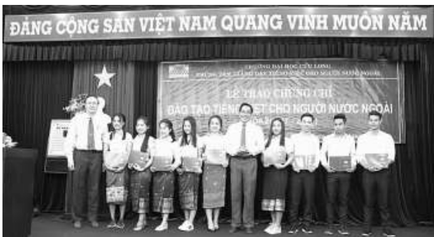
Các bạn Lưu học sinh Lào nhận chứng chỉ.

người nước ngoài đã tạo mọi điều kiện thuận lợi để chúng em có thể hoàn thành khóa học với một kết quả tốt nhất để có thể trang bị hành trang kiến thức thực hiện ước mơ của mình.