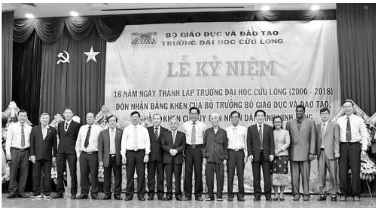
Chụp hình lưu niệm

Thành tích đạt được của trường Đại học Cửu Long sau hơn 18 năm hình thành và phát triển đánh dấu chặng đường phát triển bền