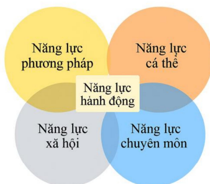
Sơ đồ 1. Thành phần cấu trúc của năng lực

Như vậy, năng lực có thể được hiểu là khả năng của cá nhân được hình thành bởi những tiềm năng có sẵn trong bản thân họ, đồng thời đó cũng là kết quả của quá trình rèn luyện, học tập để đạt được những kỹ năng giải quyết vấn đề có hiệu quả cao trong cuộc sống. Và với cách hiểu này, giáo dục đại học có vai trò vô cùng quan trọng trong việc hình thành năng lực cần thiết cho sinh viên cả về chuyên môn, nghiệp vụ và các kỹ năng mềm đáp ứng nhu cầu của xã hội. Cấu trúc của năng lực bao gồm các thành tố sau: