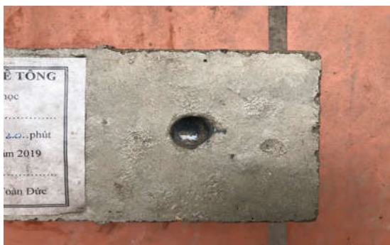
Hình 1.c. Khoan lớp bê tông bảo vệ tới vị trí cốt thép