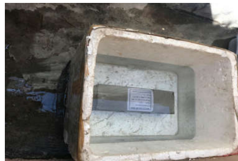
Hình 1.b. Ngâm mẫu