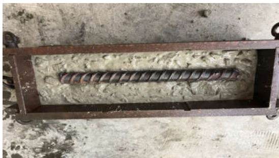
Hình 1.a. Đúc mẫu

Nghiên cứu xác định độ ăn mòn của cốt thép trong bê tông được tiến hành theo tiêu chuẩn hiện hành [5]. Bê tông đúc mẫu đầm là 03 loại bê tông có cấp phối tối ưu ở trên, đầm bê tông có kích thước 100x100x400 được đặt thanh thép đường kính D22 cách bề mặt lớp bê tông bảo vệ 4 cm. Mẫu được ngâm trong môi trường xâm thực mạnh trong thời gian 06 tháng - hình 1.