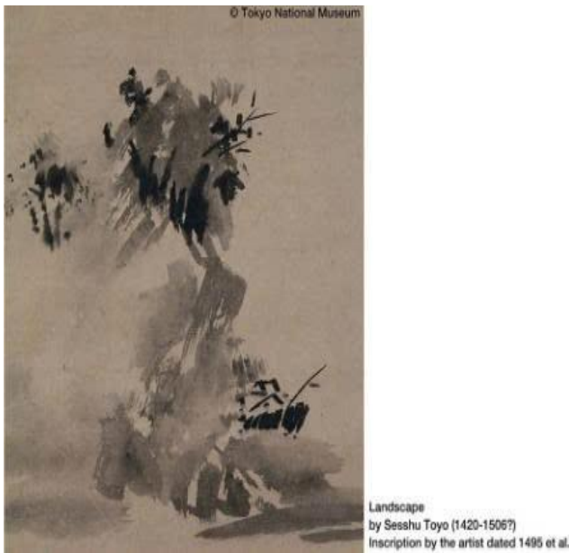
Hình 1. Sesshū Tōyō, Phong cảnh mực vờ, Bảo tàng Quốc gia Tokyo.

Một trong những nghệ sĩ nổi tiếng nhất trong lịch sử của Sumi-e là Sesshū Tōyō (1420-1506) với phong cách sáng tạo và tinh tế, các tác phẩm của ông không chỉ đơn thuần là những bức tranh, mà còn là những kiệt tác nghệ thuật chứa đựng tư tưởng và triết lý sâu sắc. Những chủ đề phổ biến trong Sumi-e bao gồm cảnh quan thiên nhiên, động vật và thực vật, mỗi tác phẩm đều phản ánh sự tinh tế và nhạy cảm của nghệ sĩ đối với thế giới xung quanh. Tác phẩm nổi tiếng nhất của ông là tranh Haboku Sansui (Takashima Shuji, 2018)