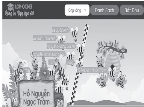
Hình 1: Tổ chức trò chơi BeeRace khi dạy văn bản “Tầng hai”

Hoạt động nhóm, thảo luận bằng cách ứng dụng công nghệ: Tạo phòng thảo luận nhóm trực tuyến (Google Meet, Zoom breakout rooms nếu học online hoặc dùng Zalo nhóm lớp để phản hồi). Dùng Mentimeter hoặc Slido để thu thập nhanh các quan điểm cá nhân (ẩn danh hoặc công khai). HS thuyết trình qua PowerPoint hoặc Canva, có thể thu âm bài thuyết trình rồi chiếu cho cả lớp nghe.