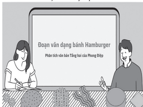
Hình 2: HS thuyết trình qua phần mềm Canva

Hoạt động nhóm, thảo luận bằng cách ứng dụng công nghệ: Tạo phòng thảo luận nhóm trực tuyến (Google Meet, Zoom breakout rooms nếu học online hoặc dùng Zalo nhóm lớp để phản hồi). Dùng Mentimeter hoặc Slido để thu thập nhanh các quan điểm cá nhân (ẩn danh hoặc công khai). HS thuyết trình qua PowerPoint hoặc Canva, có thể thu âm bài thuyết trình rồi chiếu cho cả lớp nghe.