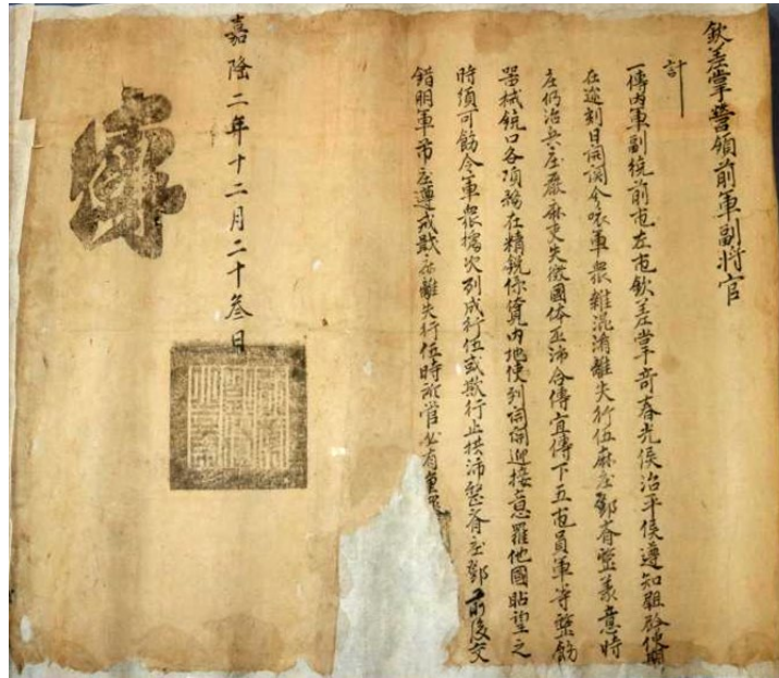
Ảnh 1: Tờ truyền đóng ấn 前軍副將之印 Tiền quân Phó tướng chi ấn của Trương Tấn Bửu

nhiệm Quyền Tổng trấn Bắc Thành thì các văn bản này đều do tướng Trương Tấn Bửu phân phái.