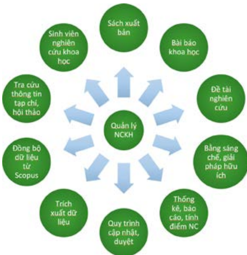
Hình 1. Minh họa về nội dung quản lý cơ sở dữ liệu về hoạt động nghiên cứu khoa học trong trường đại học

Hỗ trợ công cụ tìm kiếm và phân loại nâng cao: Do tính chất đặc thù của các tài liệu và dự án trong ngành Kiến trúc, cơ sở dữ liệu cần tích hợp các công cụ tìm kiếm và phân loại thông minh để giúp người dùng dễ dàng