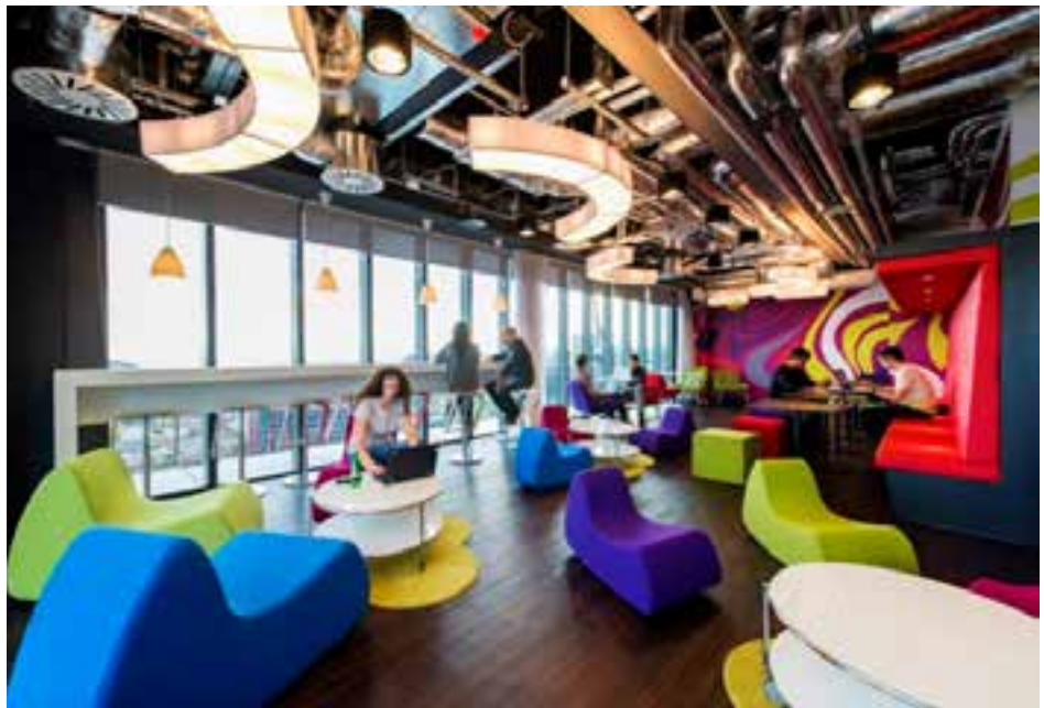
Hình 3. Không gian thư giãn văn phòng Google

Một ví dụ thành công trên thế giới là không gian văn phòng làm việc của Google. Tại Google, nhân viên luôn được hưởng chính sách làm việc tốt nhất. Những nhà điều hành luôn quan tâm đến sự hài lòng trong môi trường văn phòng làm việc của nhân viên. Chính vì thế mà năng suất làm việc cũng được tăng trưởng rõ rệt. Văn phòng làm việc tại Google được thiết kế theo xu hướng mở. Không có sự tồn tại của những vách ngăn giữa các nhân viên mà thay vào đó là môi trường chung cho mọi người. Ngoài ra, Google cũng đầu tư rất nhiều vào từng góc làm việc. Có hàng ngàn khu vực bàn làm việc với thiết kế độc đáo, khác biệt nhau.