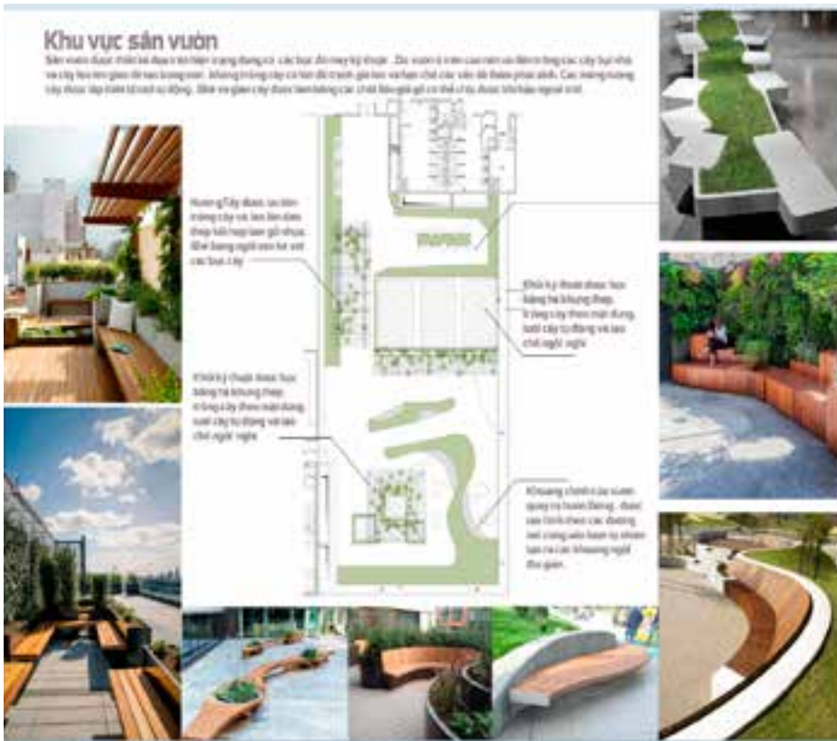
Hình 7. Giải pháp tổ chức không gian sân vườn văn phòng Fsoft Vietnam