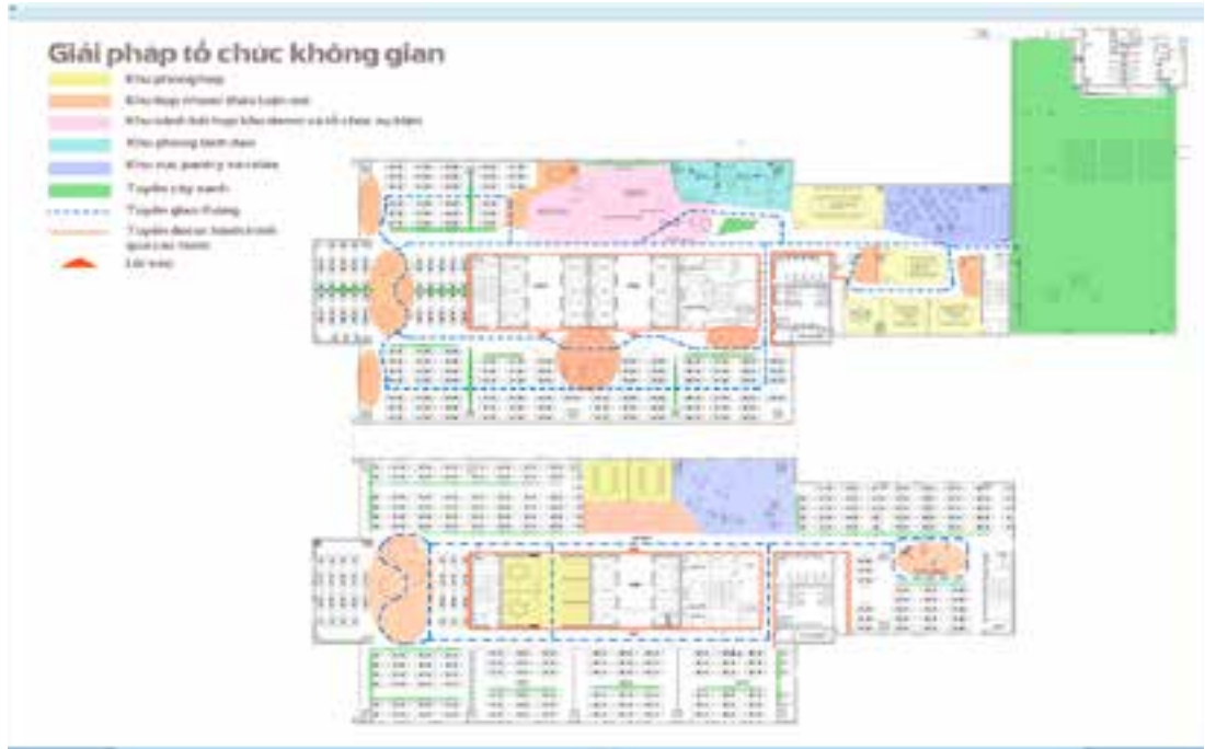
Hình 5. Giải pháp tổ chức không gian chức năng văn phòng Fsoft Vietnam

cho việc sử dụng gồm các module điển hình sắp xếp với nhau. Đối với các không gian này, yêu cầu về sáng tạo không nên được ưu tiên hàng đầu. Các không gian sáng tạo cần được ưu tiên sẽ tập trung vào các không gian công cộng như: sảnh đón tiếp đa năng, khu nghỉ ngơi thư giãn canteen, các phòng họp và không gian hiện, sân vườn (nếu có).