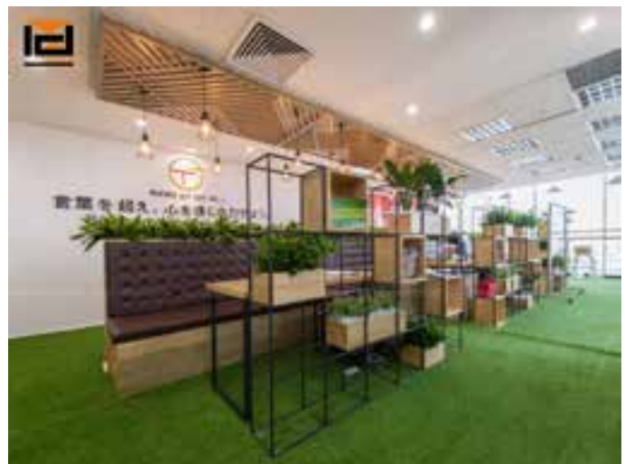
Hình 4. Văn phòng OJT- Văn phòng như một quán cafe. Thiết kế bởi ICADVietnam

Trong văn phòng không gian làm việc chiếm diện tích lớn nhất, nó cần được thiết kế đảm bảo tiện dụng tối đa