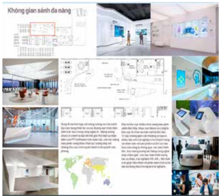
Hình 6. Một số giải pháp tổ chức không gian sảnh đa năng văn phòng Fsoft Vietnam

Đây là những không gian ngoài trời quan trọng, giúp nhân viên thư giãn và tái tạo năng lượng. Cần được thiết kế sinh động và có mối liên hệ tốt/trực tiếp với các không gian thư giãn, canteen và họp.