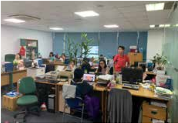
Hình 1. Phòng làm việc VINASA tại Việt Nam