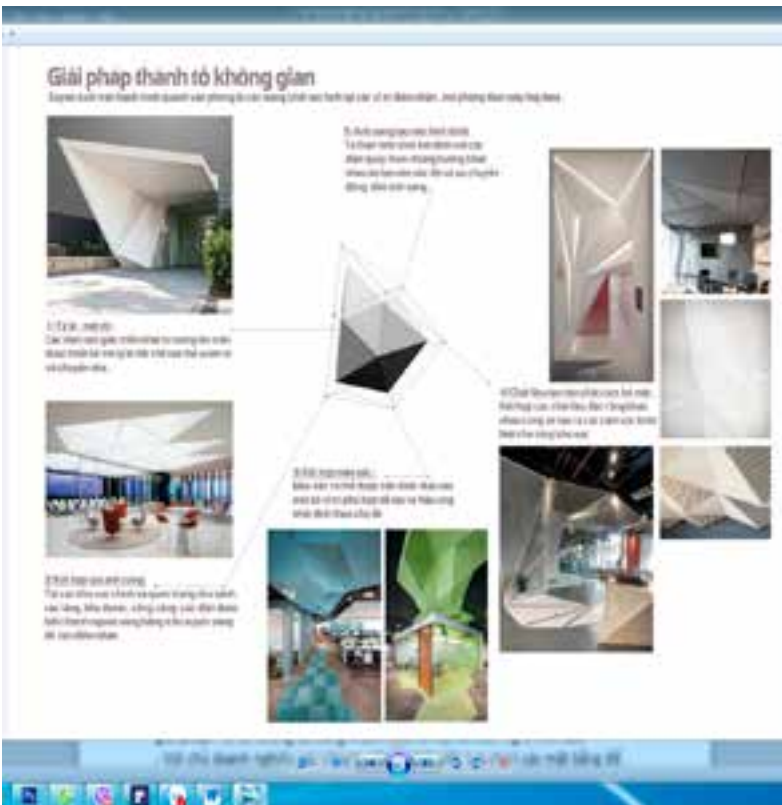
Hình 8. Một số giải pháp thẩm mỹ các thành tố không gian văn phòng Fsoft Vietnam

rất cần các ý tưởng về thẩm mỹ và sáng tạo để hình thành lên các không gian phong phú, đặc sắc.