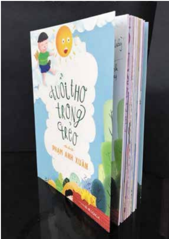
Ảnh 2. Sinh viên Khoa Mỹ thuật ứng dụng minh họa thực tế cho Nhà sách Đông A

Thứ hai là đào tạo chính quy. Các trường đào tạo chính quy (đại học, cao đẳng) về ngành thiết kế đồ họa hiện nay có thời gian đào tạo dài, chú trọng vào việc đào tạo sâu về kiến thức mỹ thuật, ý tưởng sáng tạo. Một số trường chưa chú trọng đúng mức tới khâu đầu tư, gắn kết thực hành, thậm chí không đào tạo kỹ năng sử dụng công cụ, phần mềm thiết kế và rèn luyện kỹ năng thực hành. Kết quả là, sinh viên ra trường tuy có kiến thức mỹ thuật vững, khả năng sáng tạo tốt, nhưng bị hạn chế ở các kỹ năng sử dụng công cụ thể hiện. Điều này dẫn đến tình trạng sinh viên tốt nghiệp khó thể hiện tốt ý tưởng sáng tạo của mình, hoặc thiếu kiến thức thực tế, hạn chế cơ hội làm việc trong môi trường cạnh tranh.