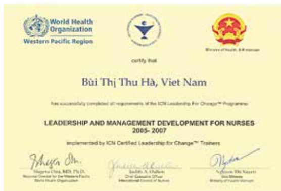
Hình 1. Chứng chỉ hoàn thành khóa học LFC

phép đào tạo LFC và chỉ được đào tạo sau khi có giấy phép đồng ý của ICN, đồng nghĩa với việc ICN cấp chứng chỉ hoàn thành khóa học của ICN.