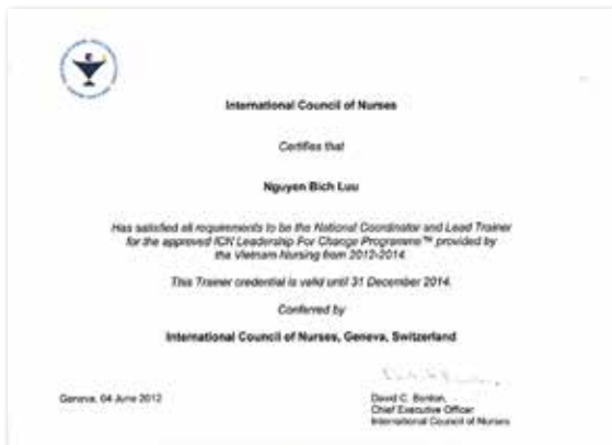
Hình 3. Chứng chỉ Điều phối viên và Trưởng nhóm giảng viên LFC của ICN

Mỗi khóa đào tạo LFC thực hiện tại Việt Nam., học viên được học tập trung 20 ngày (280 tiết học, mỗi tiết 50 phút), chia làm 4 hội thảo; mỗi hội thảo cách nhau 3-6 tháng, riêng hội thảo 3 cách hội thảo 4 là 6 tháng (để học viên hoàn thành bài tập dự án nhóm). Giữa các hội thảo, học viên phải hoàn thành bài tập về nhà.