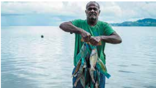
Cá thường có mặt trong thực đơn hàng ngày của người dân Fiji.

Vì là một đảo quốc, bốn bề đại dương bao quanh nên thực đơn hàng ngày của người Fiji chủ yếu là các loại hải sản tươi sống. Ở đảo quốc này, người dân thường dùng hải sản tươi sống trong thực đơn hàng ngày - những loại cá tươi ngon vừa mới đánh bắt chưa trải qua quá trình bảo quản hoặc phơi khô.