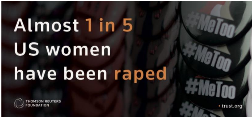
Hình 1: Khoảng 5 người phụ nữ Mỹ thì 1 người bị xâm hại